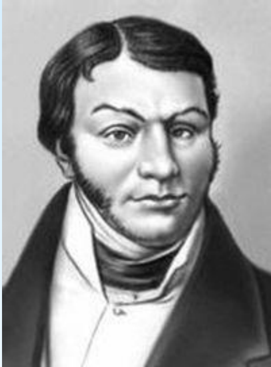
Квитка –Основьяненко Г.

Одна из версий основания принадлежит перу известного украинского писателя Григория Квитки, получившего по названию своего имени прозвище Основьяненко. Согласно его версии, наш город основан предком писателя и первым владельцем данной усадьбы – Андреем Квиткой. Якобы тот, однажды обходя свои обширные владения, был настолько поражен красотой вида, что немедленно решил основать здесь город.