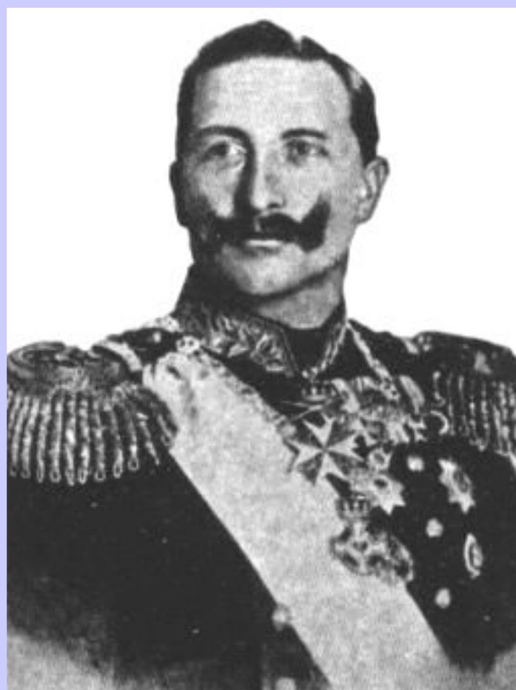
Германский император. Вильгельм I.

В 1887 г. отношения Германии и Франции обострились и лишь вмешательство Александра III, предотвратило войну. В ответ Германия начала таможенную войну.