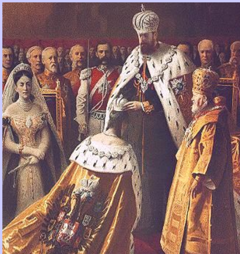
Коронация Александра III.

Александр III взял руководство внешней политикой в собственные руки. Ему помогал министр иностранных дел Н. Гирс. Важнейшие посты в министерстве сохранили дипломаты горчаковской школы.