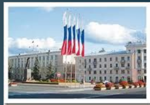
научно- исследовательские и проектные организации