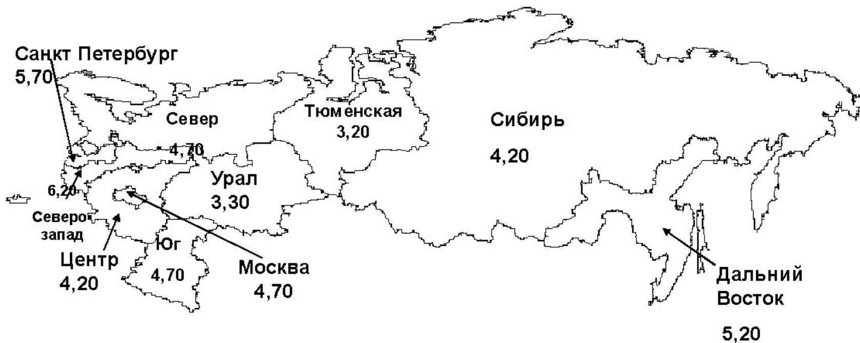
Рисунок 1: Последствия вступления России в ВТО по регионам, в процентах от регионального ВВП