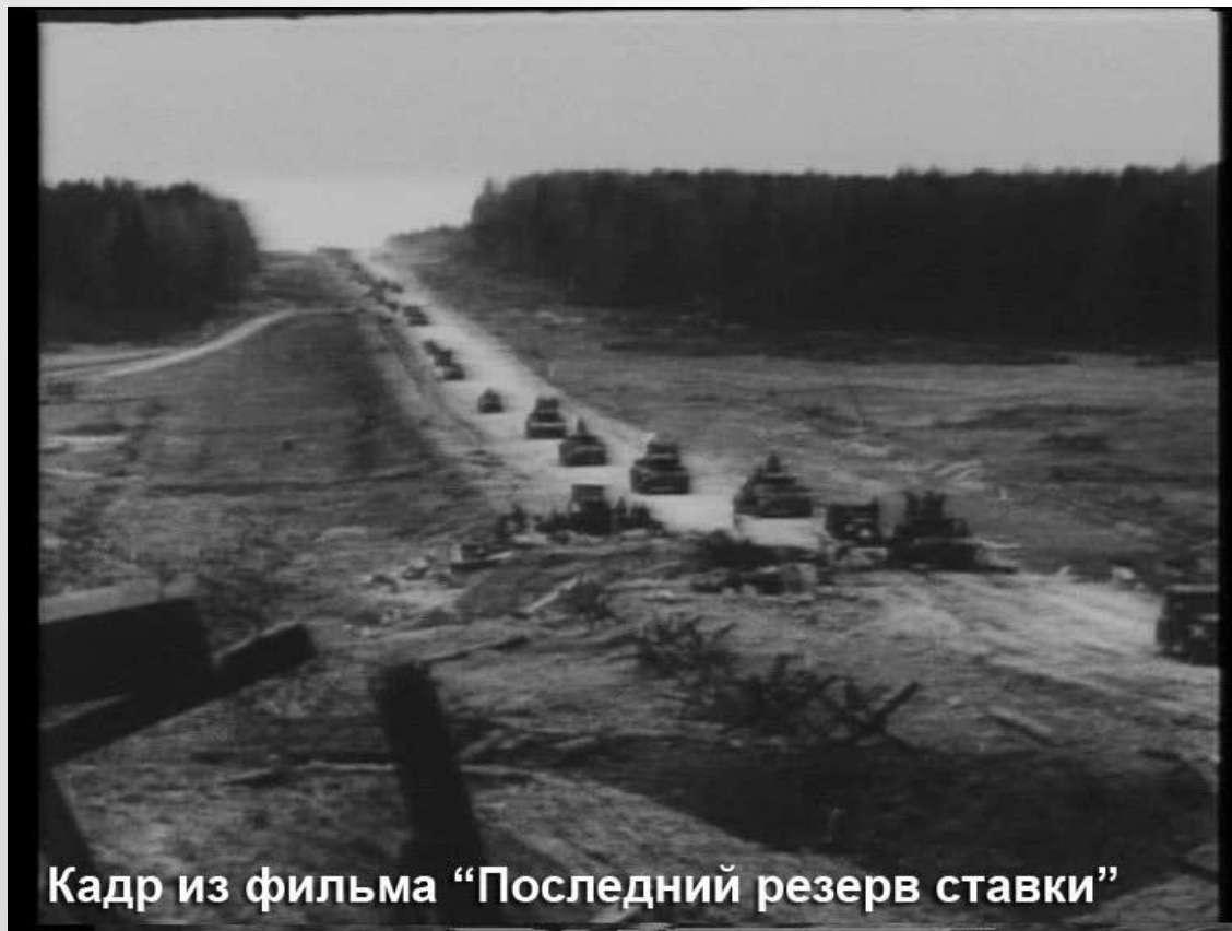
Кадр из фильма “Последний резерв ставки”

Операция "Тайфун", названная немцами "главной битвой года", началась 30 сентября 1941-го переходом в наступление Второй танковой группы генерала Гейнца Гудериана. В первых числа октября 1941 (почти сразу) они захватили в котел под Вязьмой значительные силы, также было захвачено Варшавское шоссе (дорога через Юхнов-Ильинское-Малоярославец).