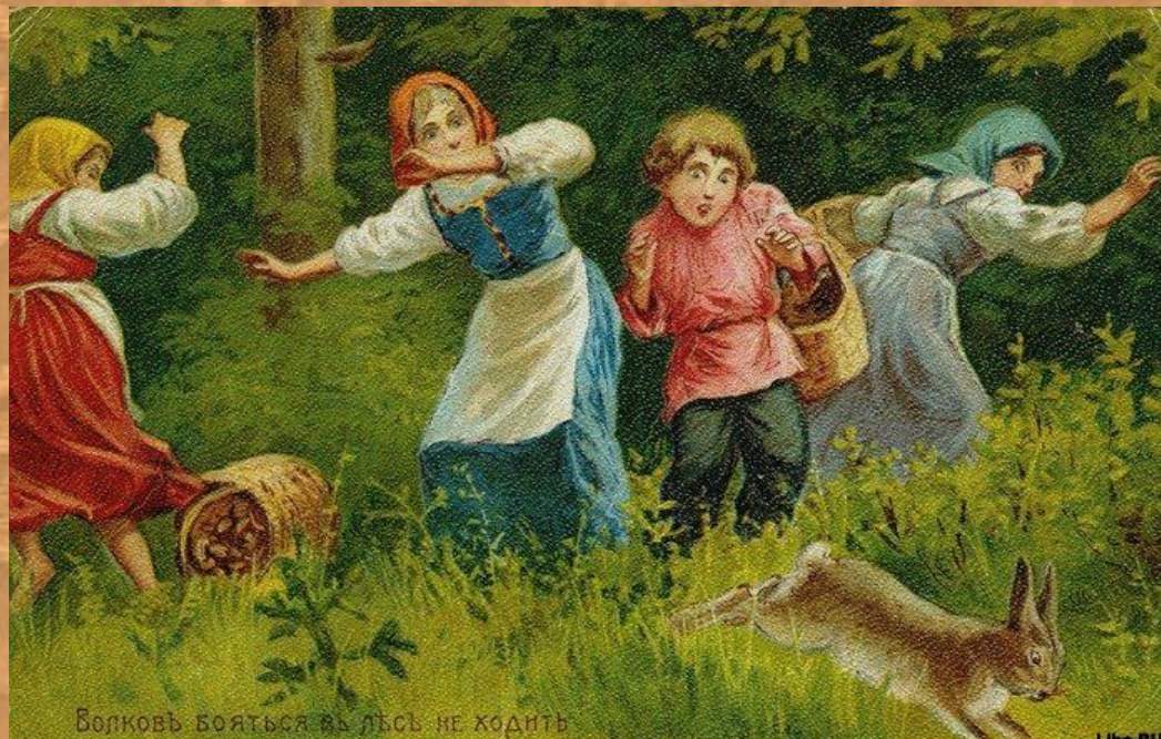
Волковъ бояться въ лѣсъ не ходить

Поговорка — это лишь часть суждения, в ней нет вывода, заключения.