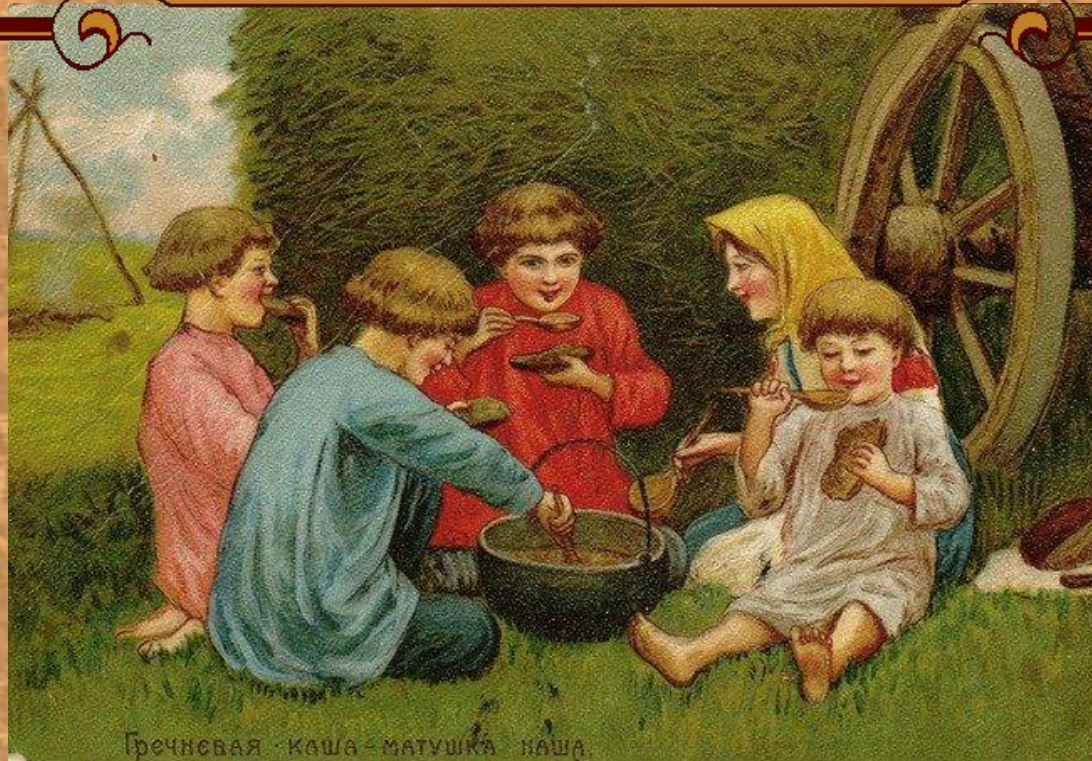
Гречневая каша - матушка наша.

Открытки с русскими пословицами и поговорками, выпущенные фирмой «Зингер»