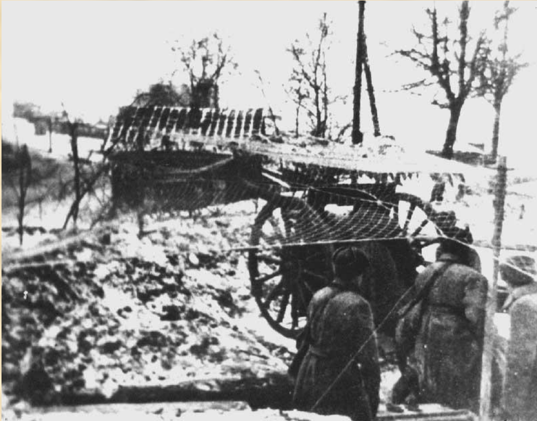
«1941г. Артиллеристы на боевой позиции (Калужское шоссе)»

В первую победу над врагом в великой битве за Москву внесла свой вклад и 5-я Московская стрелковая дивизия.