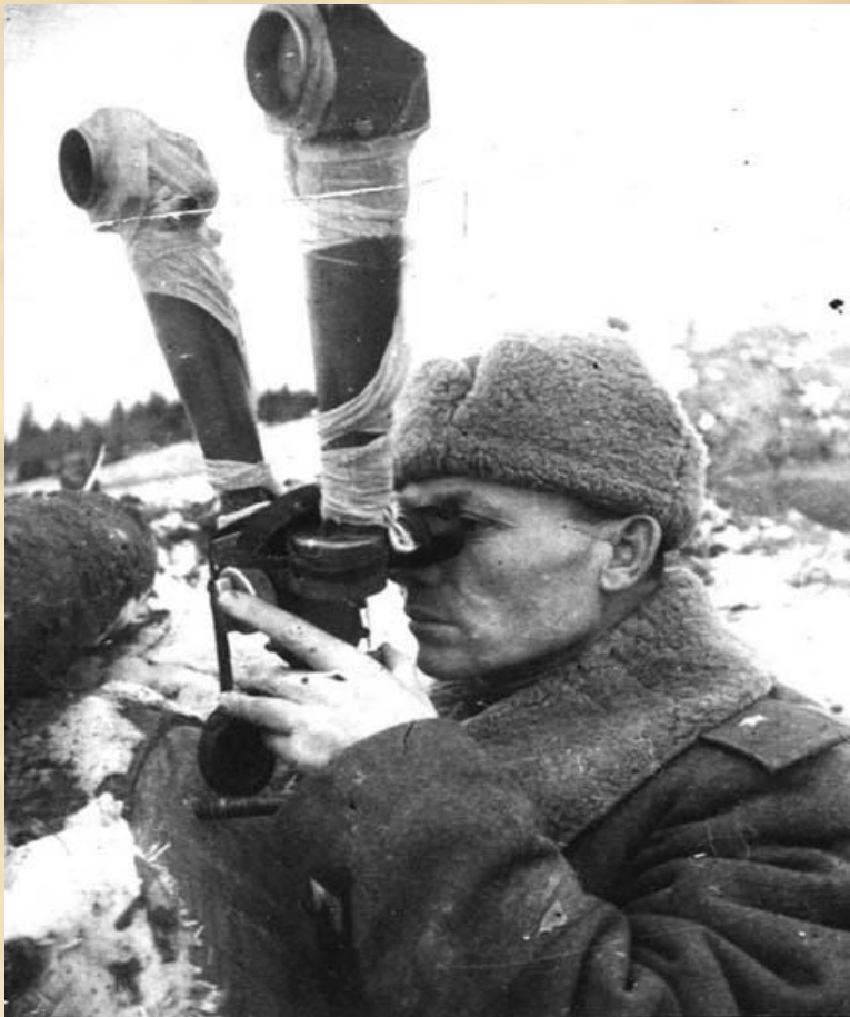
Командир дивизии И.С. Безуглый на наблюдательном пункте.

10 октября 1943г. дивизия под командованием генерал-майора Безуглого И.С. штурмом овладела городом Лиозно - важным плацдармом гитлеровцев на подступах к городу Витебску.