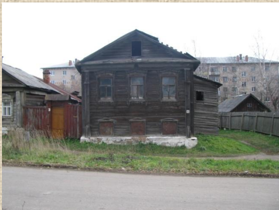
Улица 2-ая Московская (бывшая Никольская)