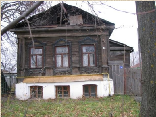
Улица Союзная, 7 (бывшая Дворянская)