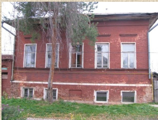
Улица Садовая, 15 (бывшая Малая Соборная)