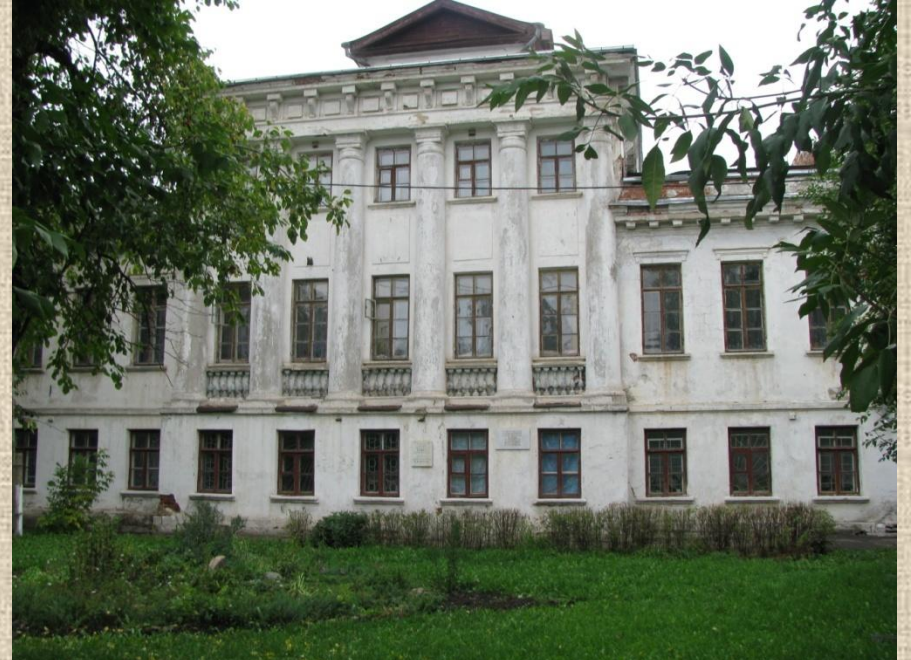
Дома купцов Посылиных в Шуче.