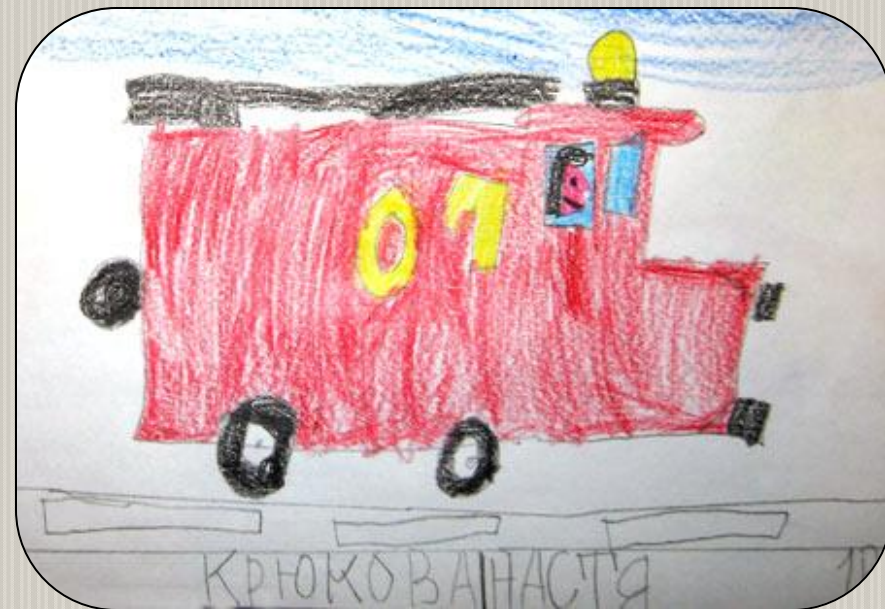
Рисунок Крюковой Насти 1 «В» класс МОУ «СОШ №31»