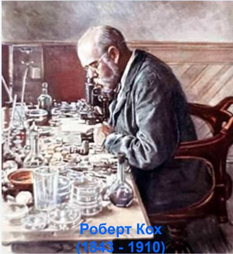
Роберт Кох (1843 - 1910)

В 1998 г. Всемирной организацией здравоохранения туберкулез был объявлен национальным бедствием, а день 24 марта «Всемирным днем борьбы с туберкулезом».