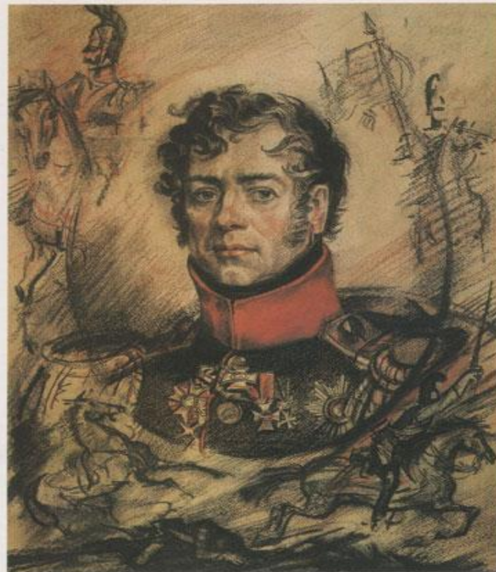
Дмитрий Владимирович Голицын 1771—1844