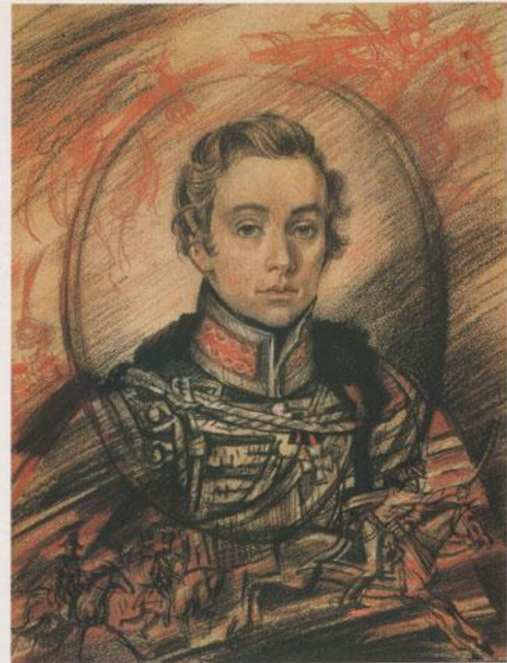
Надежда Андреевна Дурова 1783—1886