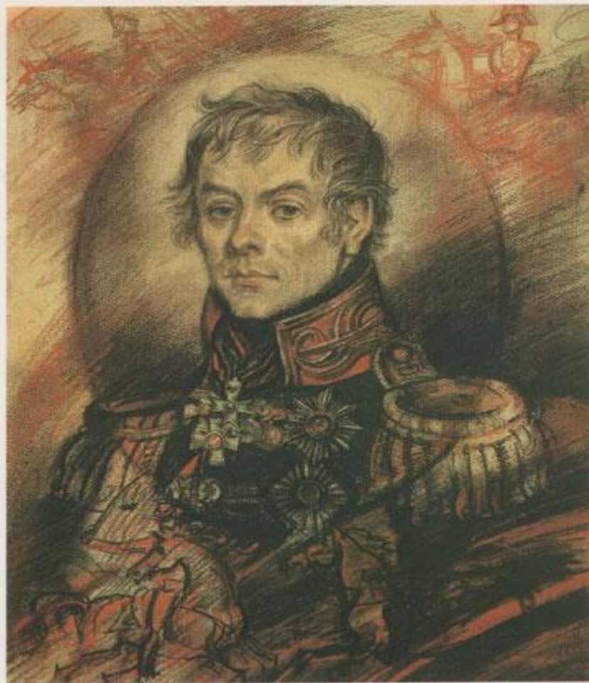
Петр Петрович Коновницын 1764—1822