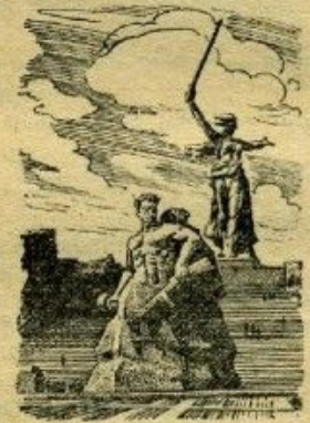
Памятник-ансамбль героям Сталинградской битвы на Мамеевом кургане. Скульптор Е. Вучетич

2 февраля после мощного огневого удара артиллерии советские войска ликвидировали в северной части города последнюю группировку противника. Этим была завершена битва под Сталинградом.