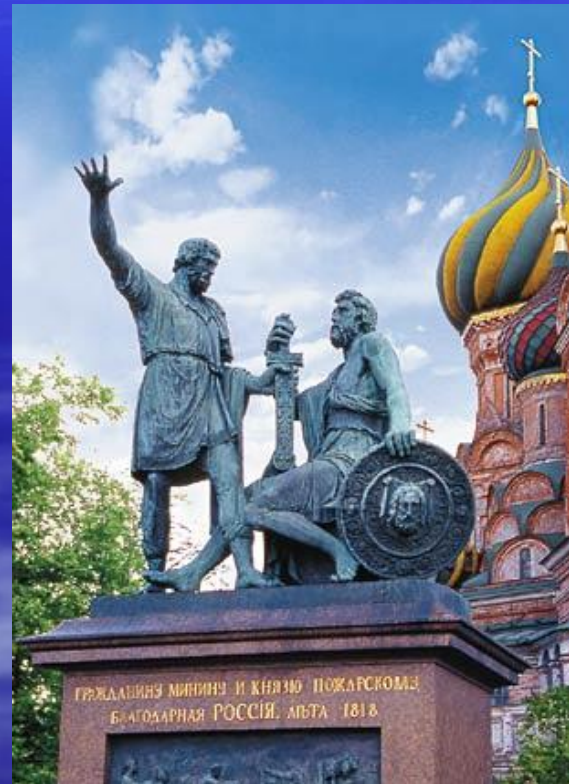
«Гражданин Минин и князь Пожарский»

День освобождения Москвы силами народного ополчения по руководством Кузьмы Минина и Дмитрия Пожарского от польских захватчиков