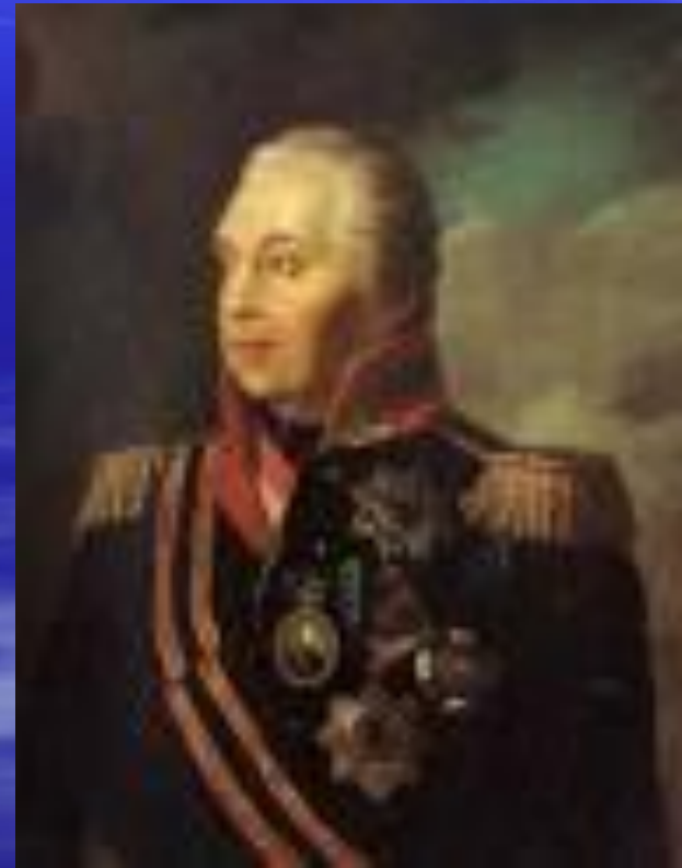
М. И. Кутузов

День Бородинского сражения русской армии под командованием М. И. Кутузова с французскими войсками