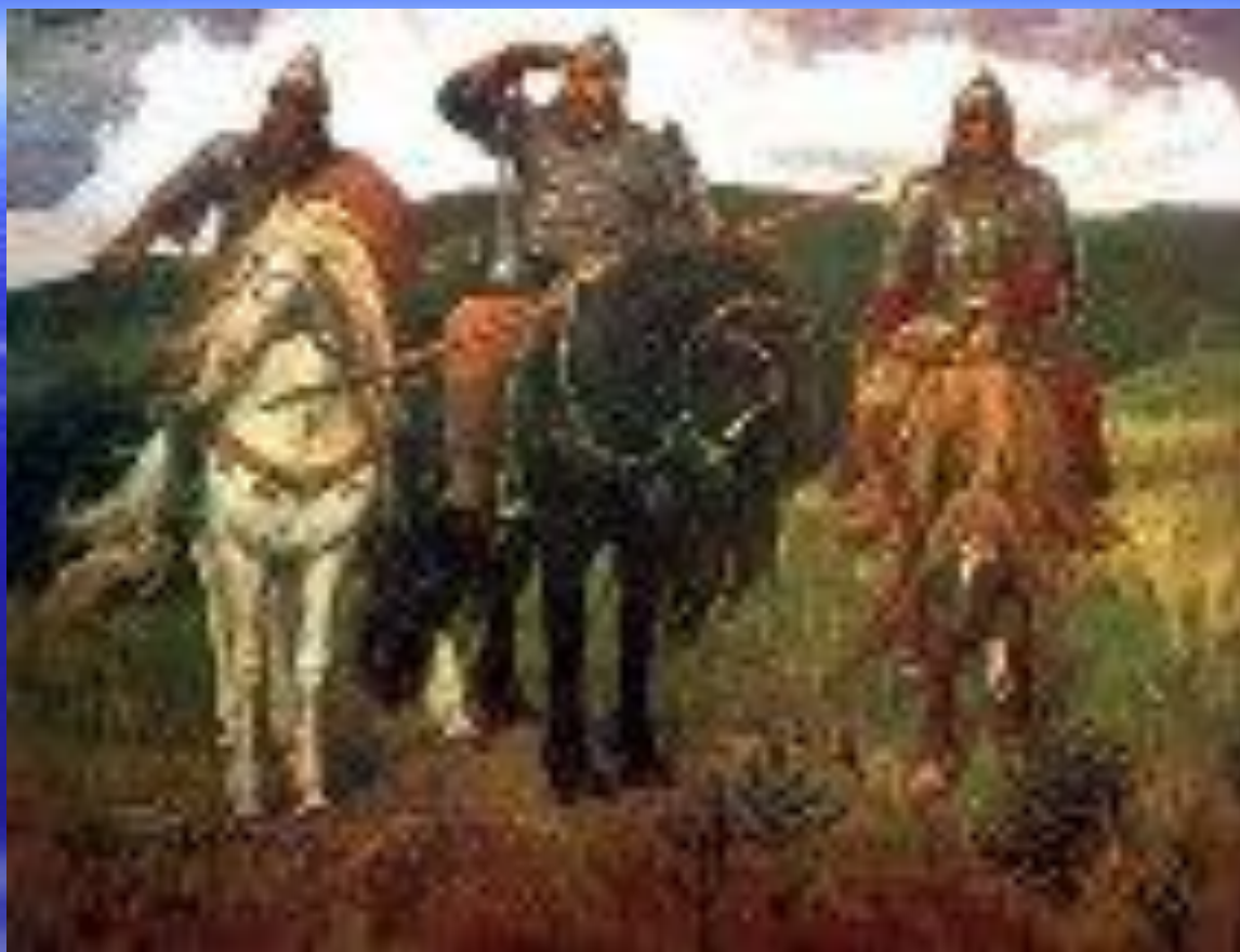
В. М. Васнецов «Три богатыря»