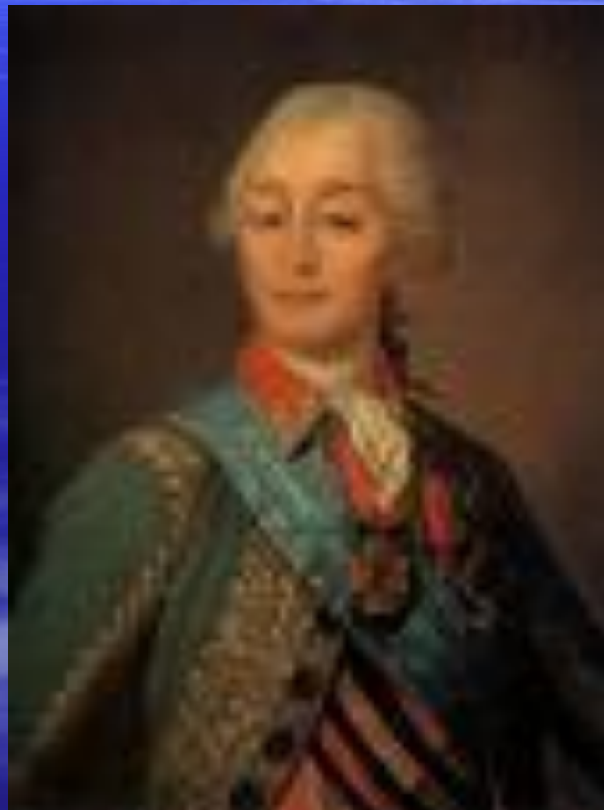
А. В. Суворов

День взятия турецкой крепости Измаил русскими войсками под командованием А. В. Суворова