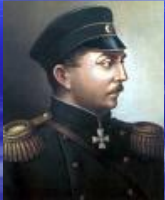
П. С. Нахимов

День победы русской эскадры под командованием П. С. Нахимова над турецкой эскадрой у мыса Синоп