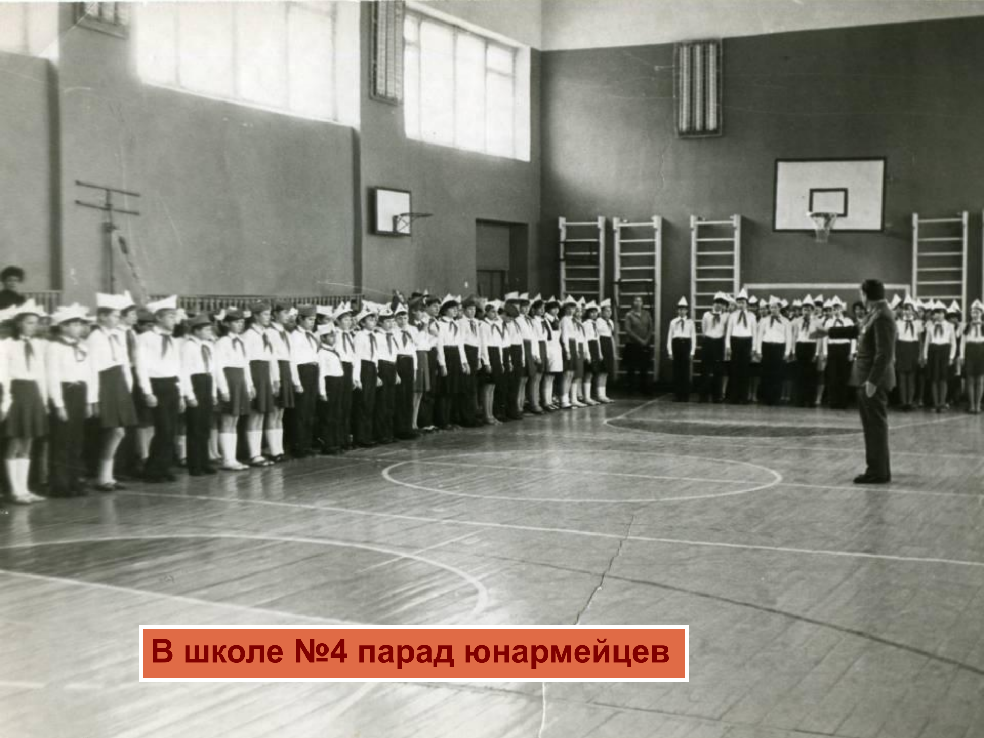
В школе №4 парад юнармейцев