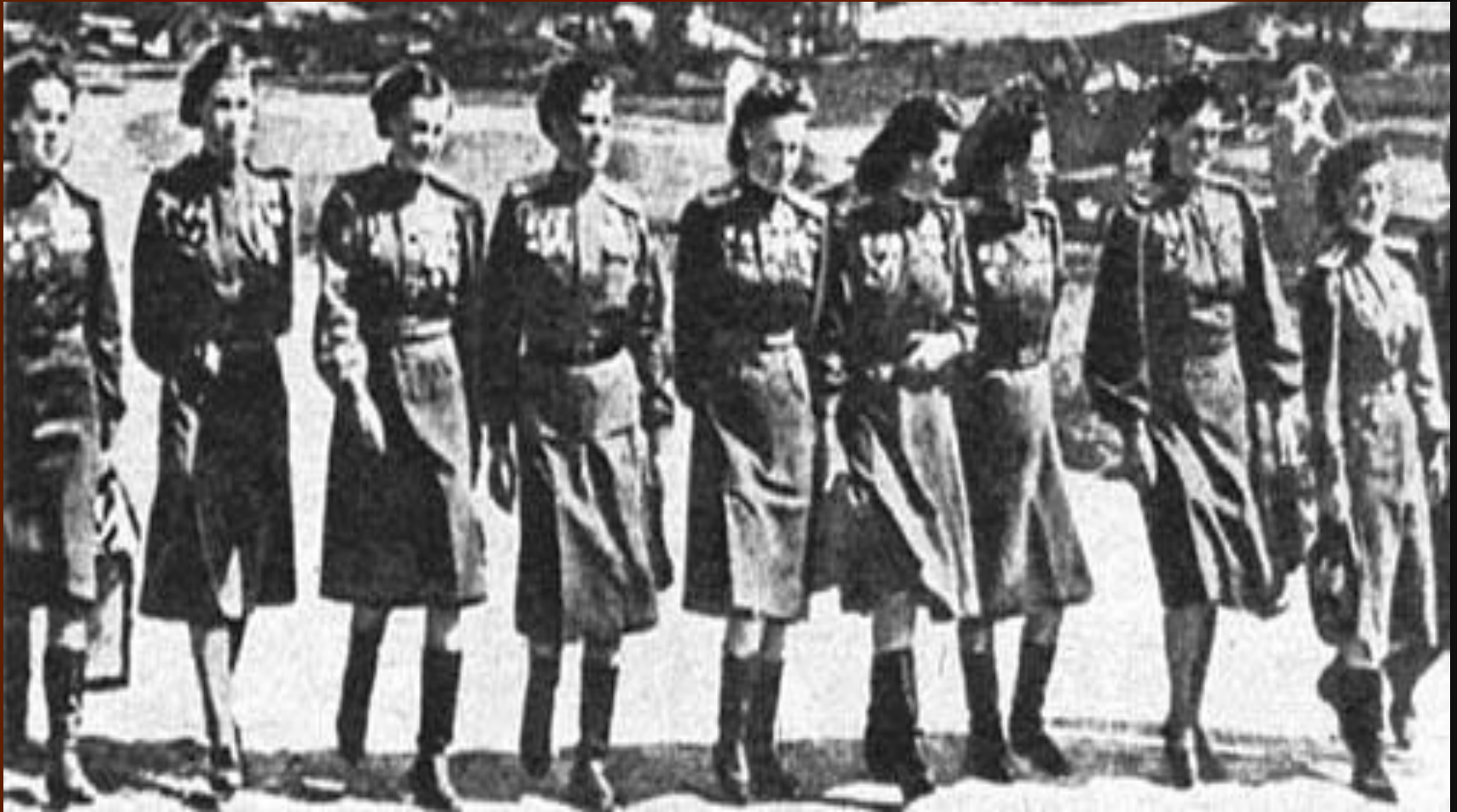
Белоруссия 1944 год.