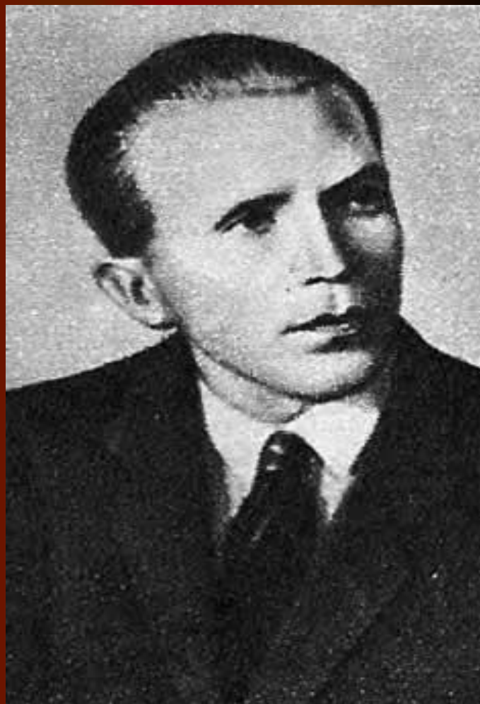
Герой Советского Союза разведчик Н. И. Кузнецов.