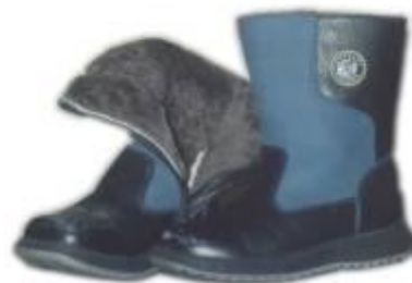
САПОГИ НА МЕХУ