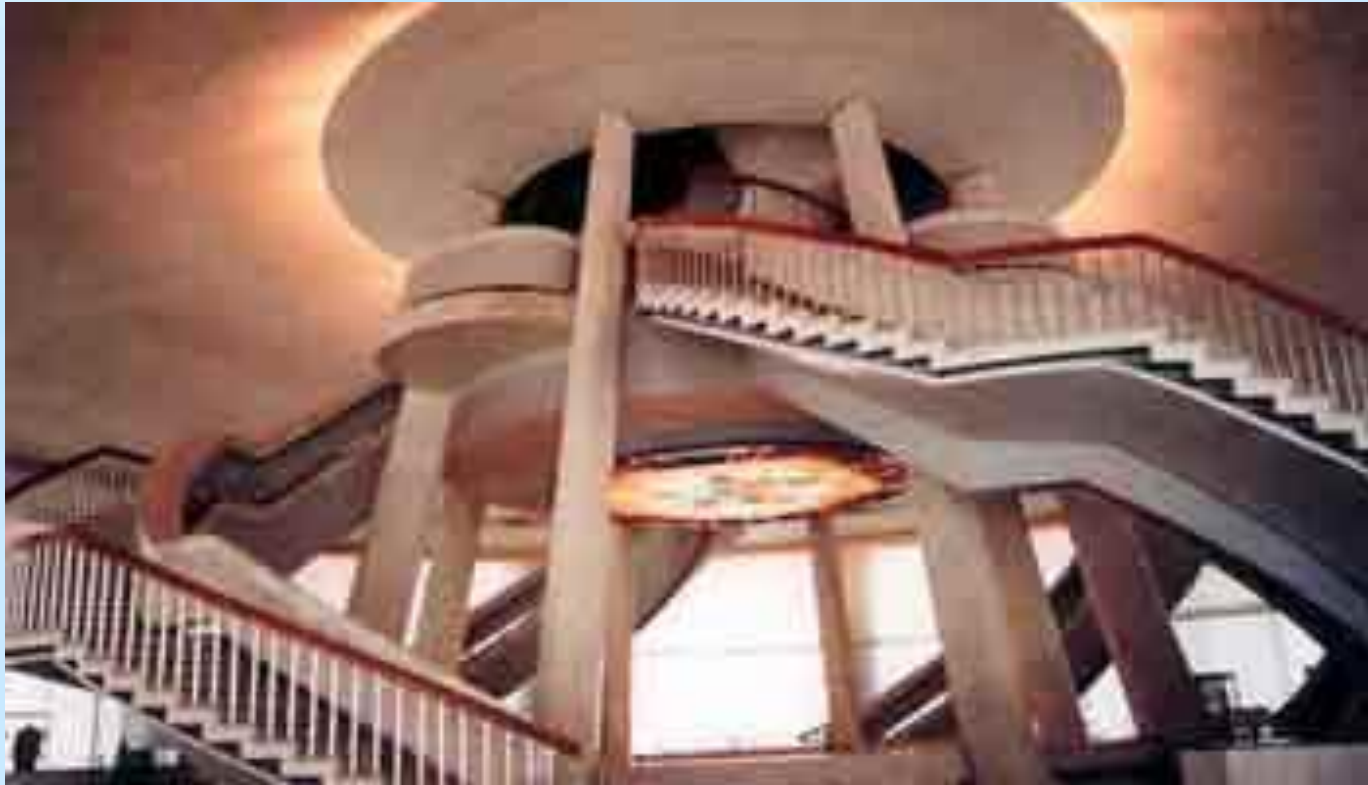
Вид предпанорамного зала