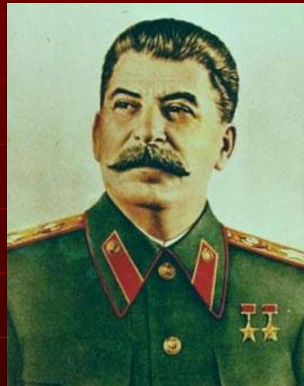
И. В. Сталин