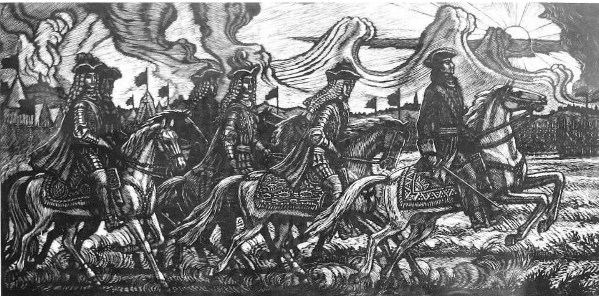
П. Г. Черняев. Иллюстрация к поэме А.С. Пушкина "Полтава"