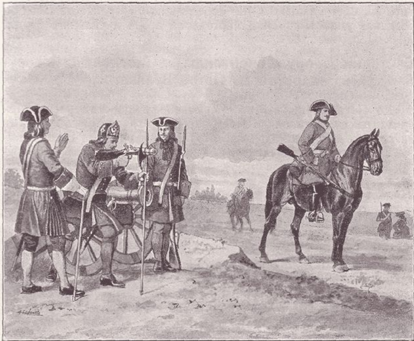
Формы одежды русскихъ войскъ при Петрѣ Великомъ.