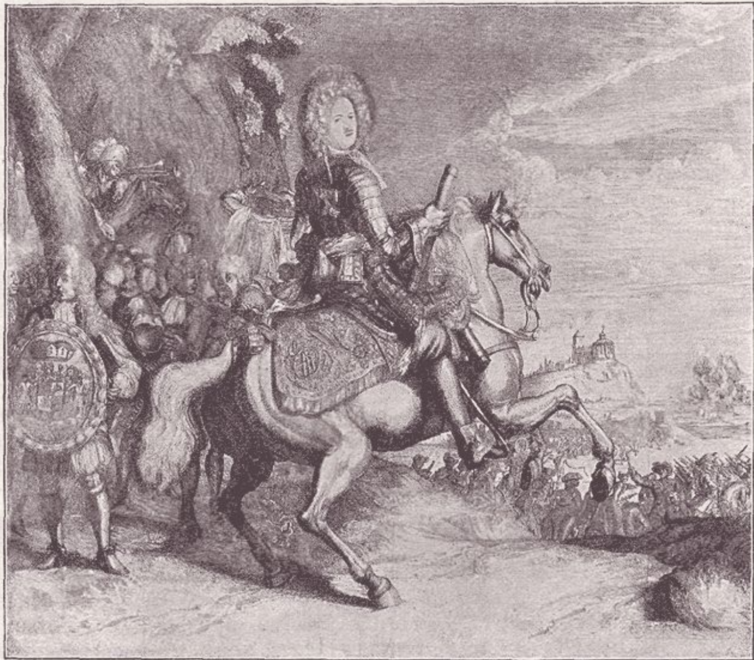
Генералъ-фельдмаршалъ Князь Александръ Даниловичъ Меншиковъ.