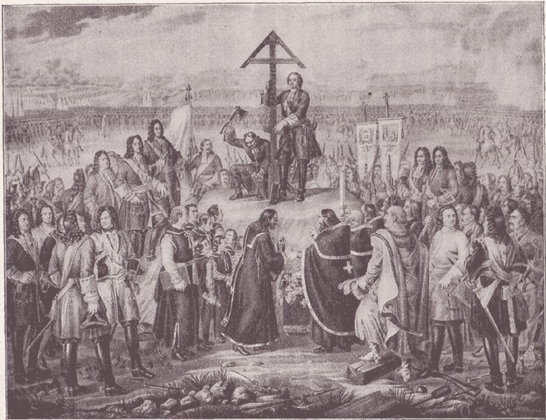
Петръ водружаетъ крестъ на братской могилѣ русскихъ воиновъ, погибшихъ въ Полтавскомъ бою.