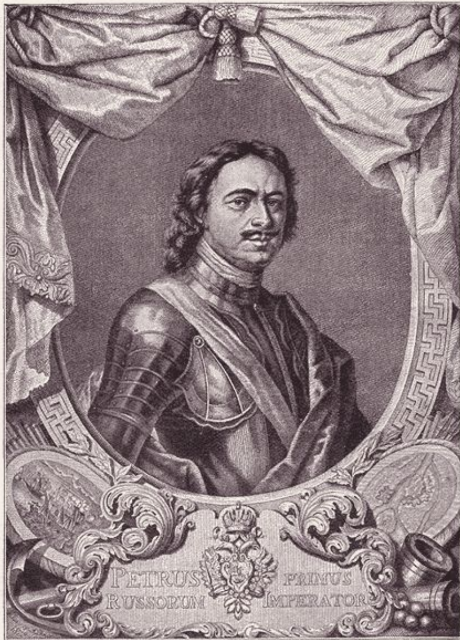
ИМПЕРАТОРЪ ПЕТРЪ ВЕЛИКІЙ.