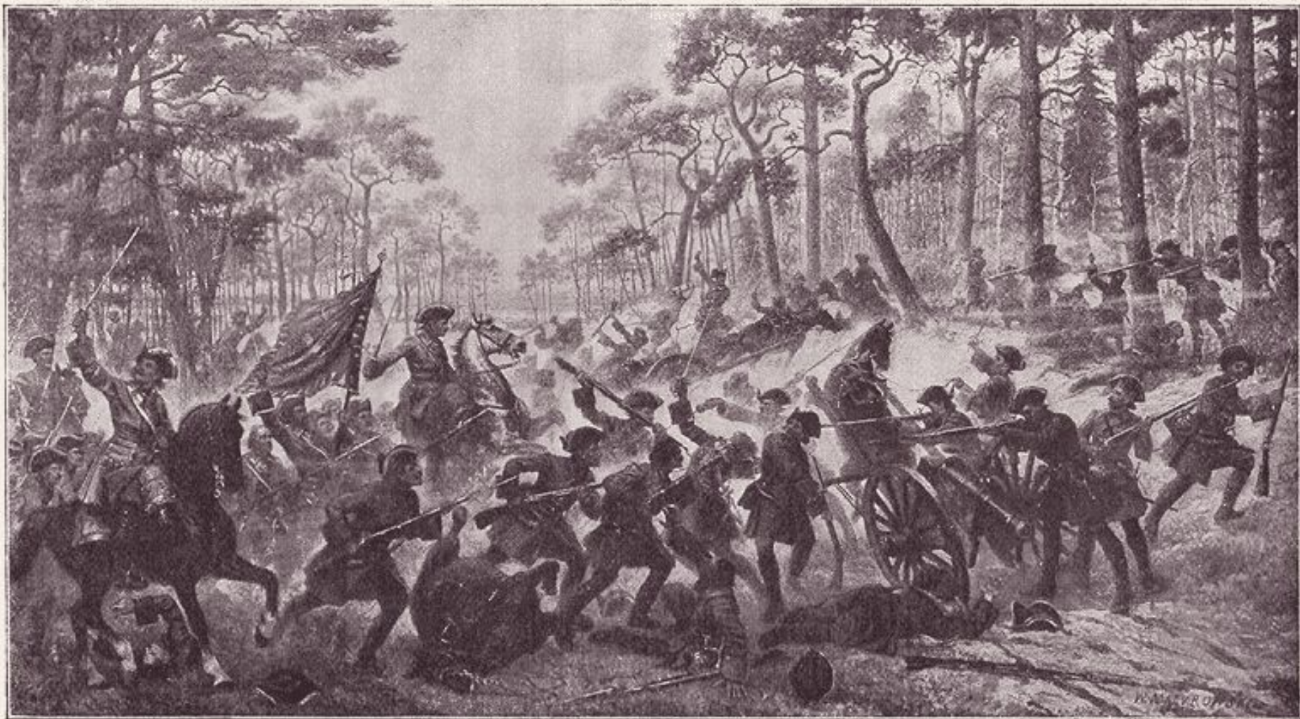
Бой при Лъсной 28-го сентября 1708 г. Картина Мазуровского.