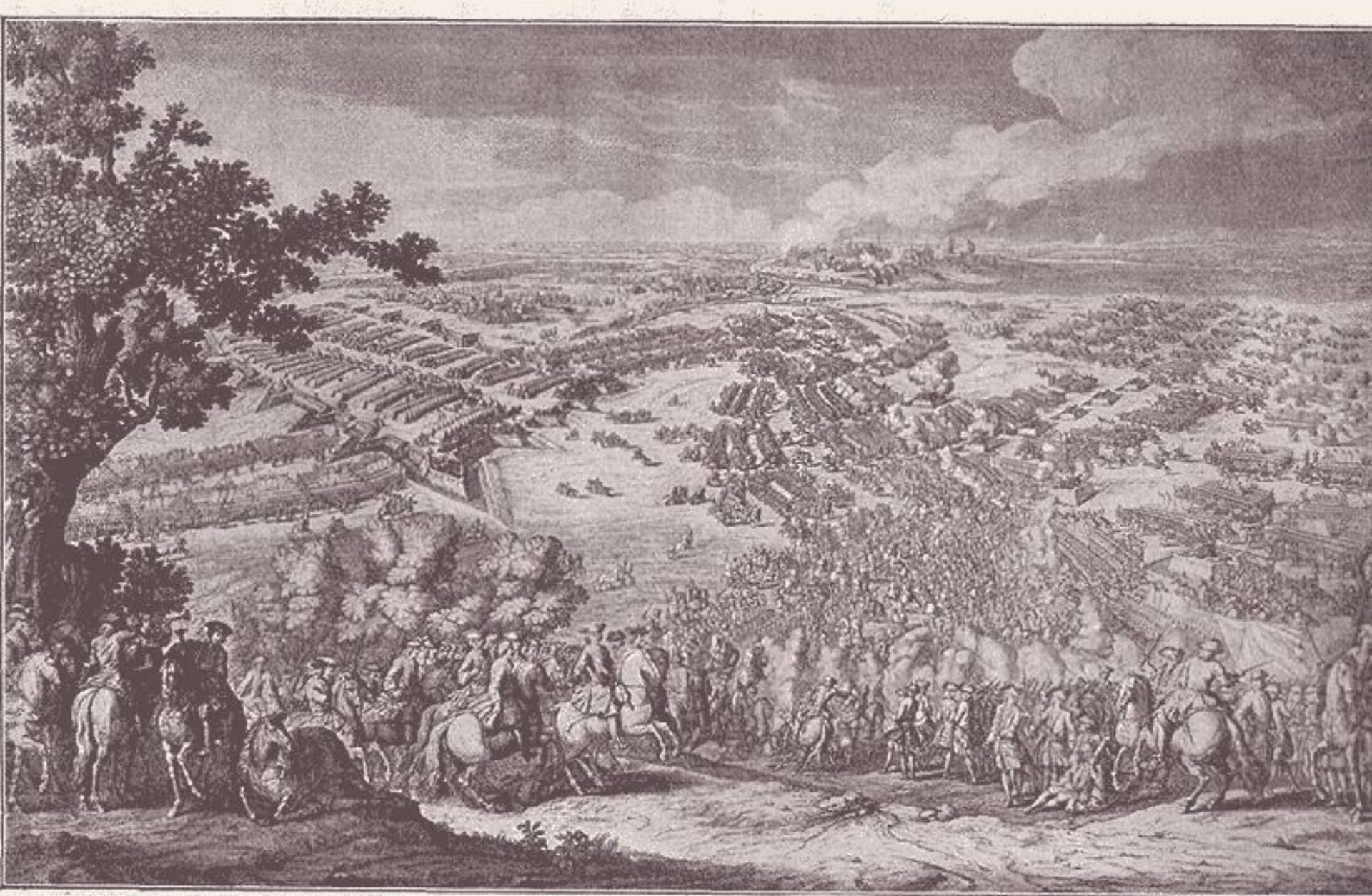
Полтавская баталія 27-го іюня 1709 г. Снимокъ съ современной гравюры.