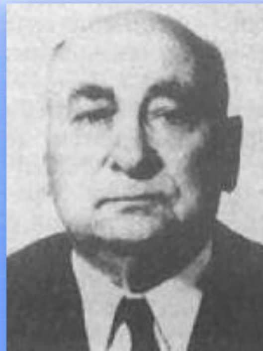
П.К.Пономаренко (1902 – 1984) - руководитель Центрального партизанского штаба.