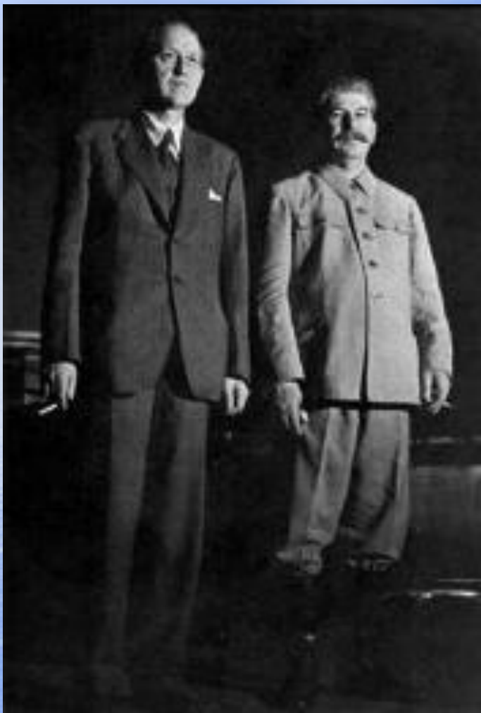
И.Сталин и Г.Хопкинс на переговорах по ленд-лизу

Летом 1941 г. Англия и США заявили о своей поддержке Советского Союза.