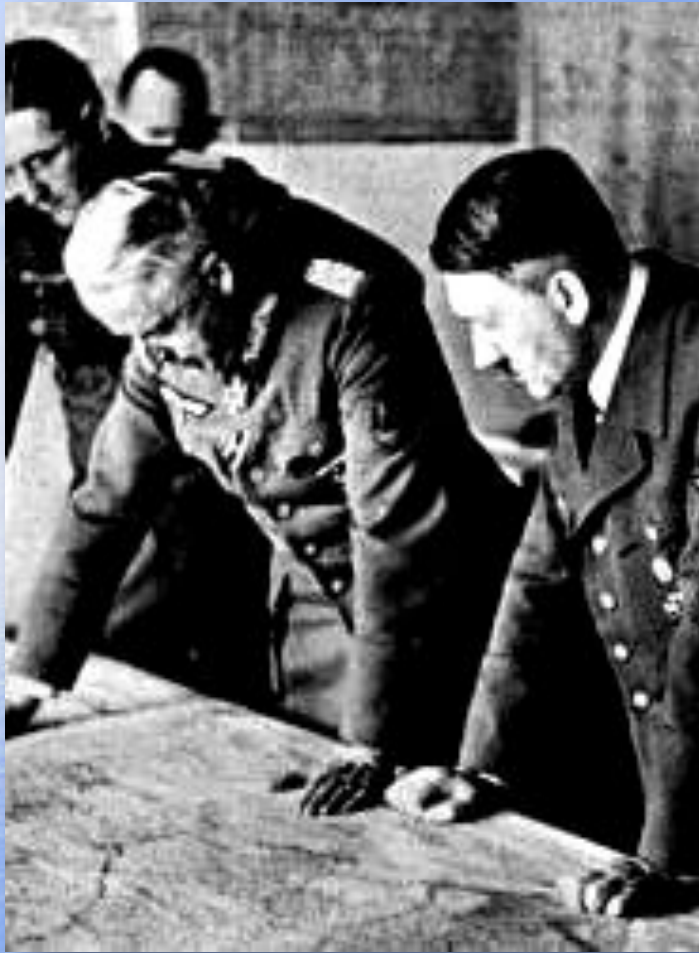
Гитлер и Манштейн у карты.

Победа под Москвой породила у И.Сталина иллюзию о быстром разгроме немецких войск и он поставил задачу в 1942г. начать общее наступление.