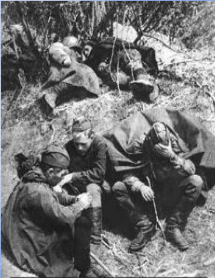
Воронежский фронт. Между боями.

В мае по инициативе С. Тимошенко советские войска начали наступление под Харьковом и даже смогли освободить город.