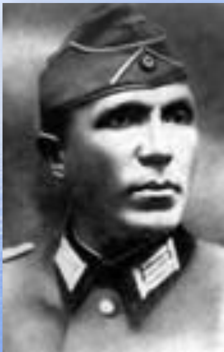
Н.И.Кузнецов (1911-1944, — советский разведчик, партизан.