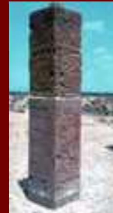
Колонна на вершине храма Кетцалькоатля Колонна покрыта иероглифами и изображением воинов- тольтеков

Статуи и колонны, а также и сама пирамида покрыта изображениями воинов, змей и крокодилов