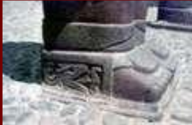
Деталь статуи Сандалии

Статуи и колонны, а также и сама пирамида покрыта изображениями воинов, змей и крокодилов