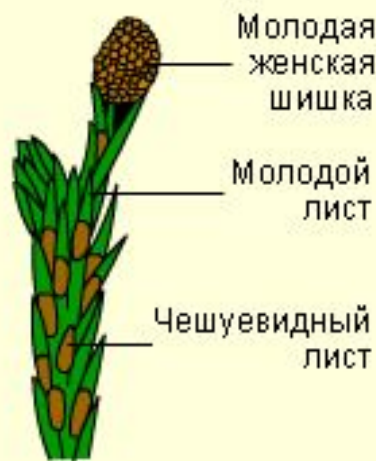
Женская шишка первого года до опыления