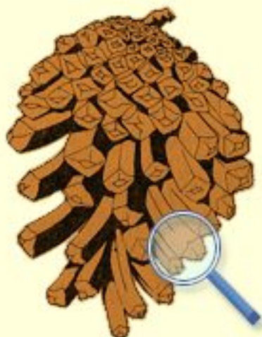
Женская шишка в конце третьего года