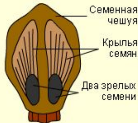
Вид семенной чешуи с верхней стороны