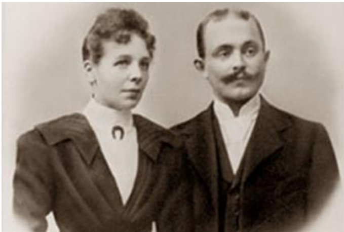
Основатель компании Иоганн Генрих Пёлькинг с супругой, 1894 год

Предложение от ПЕЛЬКИНГ – это собственные детские обувные бренды, вобравшие в себя не только полный широчайший ассортимент, но и все лучшие технологии и достижения в области производства детской обуви.