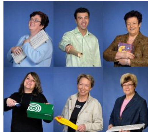
Команда ПЁЛЬКИНГ, 2009 год