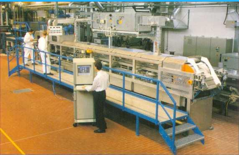
Demo Center in Fellbach, Germany