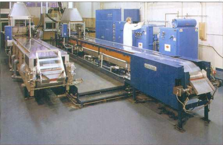
Demo Center in Totowa, N.J., USA