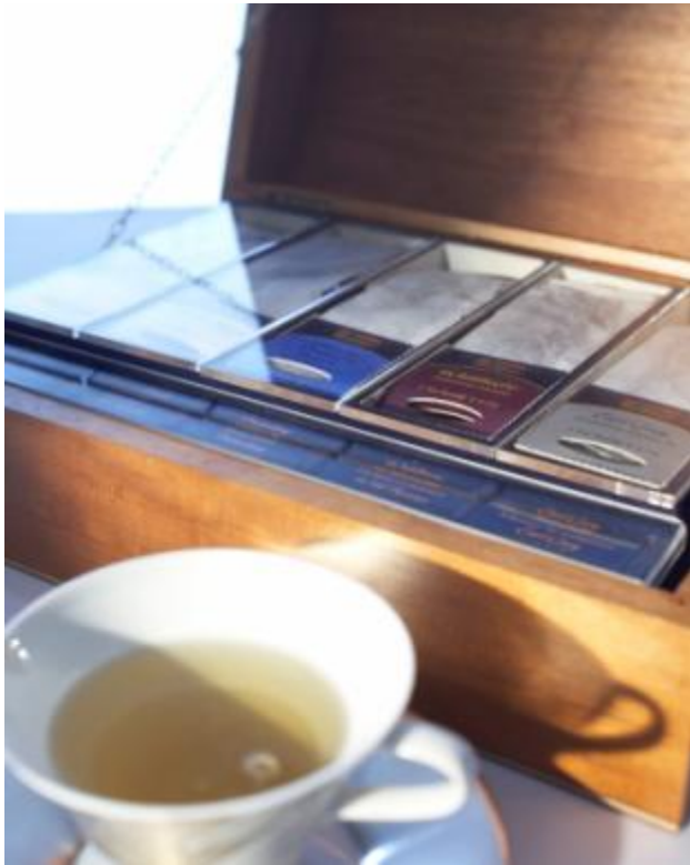
Tea Buddy Schatztruhe