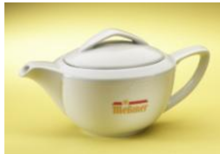
Teekännchen 0,4 l