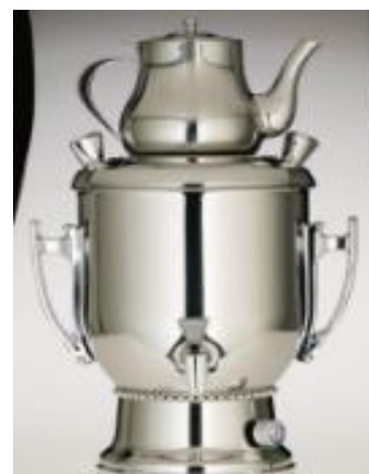
Самовар(5л, 8л, 15л)