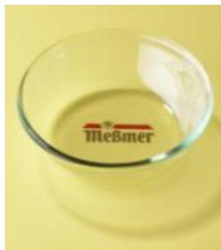
Блюдце для фильтр-пакета