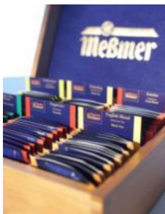
Деревянная коробка для 6 пачек