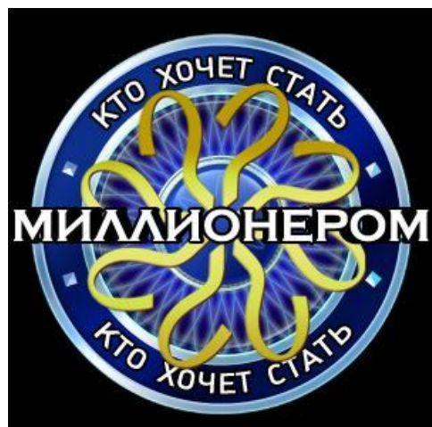
Популярные ТВ шоу