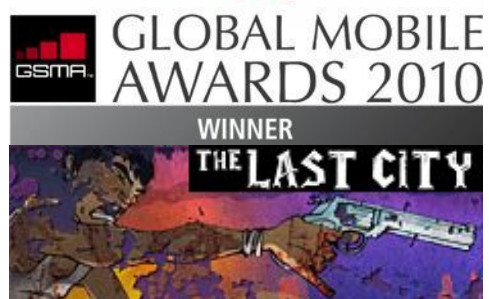
Приз «The Best Mobile Game 2010»