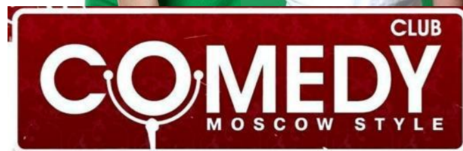
Звезды Comedy Club