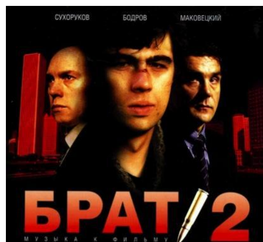
Известные российские фильмы