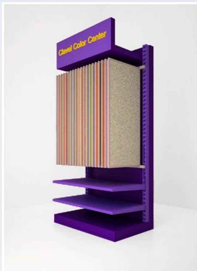
Стойка-экспозитор для декоративных красок