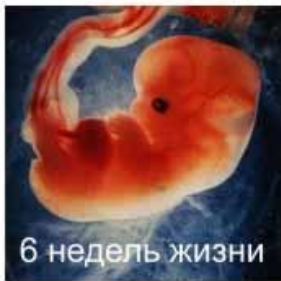
6 недель жизни

у него уже с 3-й недели от зарождения бьется зачаток сердечка, перекачивая собственную кровь. Он беззащитный, маленький, ни в чем не повинный живой человек, непричастный к обстоятельствам своего зарождения, понимаешь?