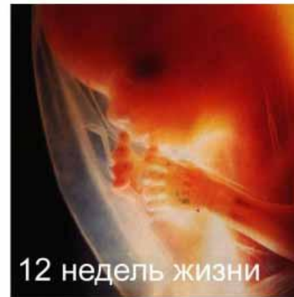
12 недель жизни

К 11-ти неделям , как свидетельствуют результаты УЗИ, малыш может испугаться громкого звука, спит и бодрствует по своему усмотрению, сосет палец, морщит брови и лоб, зевает, икает, пьет околоплодные воды, писает, почесывает подбородок, чутко реагирует на эмоциональное состояние мамы.