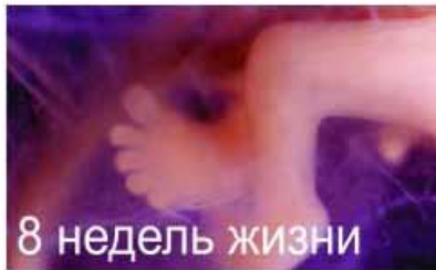
8 недель жизни

К 11-ти неделям , как свидетельствуют результаты УЗИ, малыш может испугаться громкого звука, спит и бодрствует по своему усмотрению, сосет палец, морщит брови и лоб, зевает, икает, пьет околоплодные воды, писает, почесывает подбородок, чутко реагирует на эмоциональное состояние мамы.