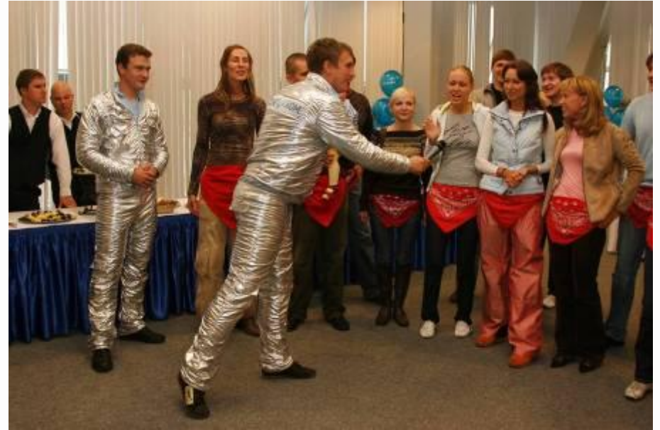
Аниматоры Снежного города - артисты, спортсмены и организаторы