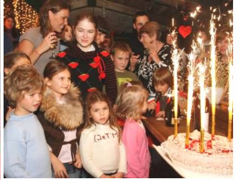
Любимые гости VIP-клуба