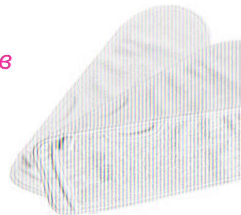
SPA – Варежка

Кожа становится чистой, гладкой и упругой, без распаривания и дополнительных средств для очищения