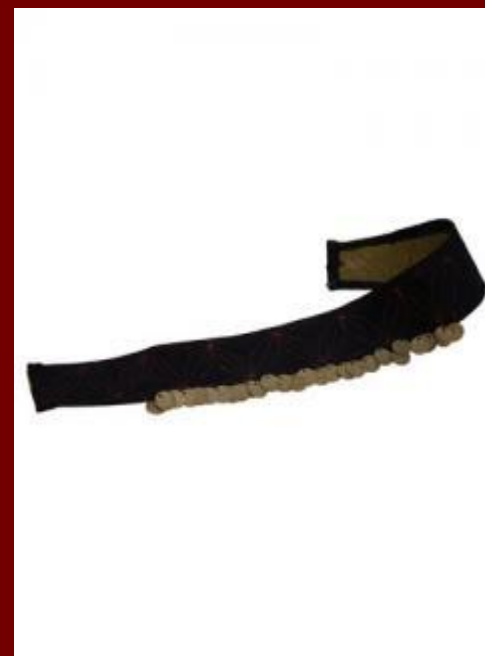
Пояс для платья