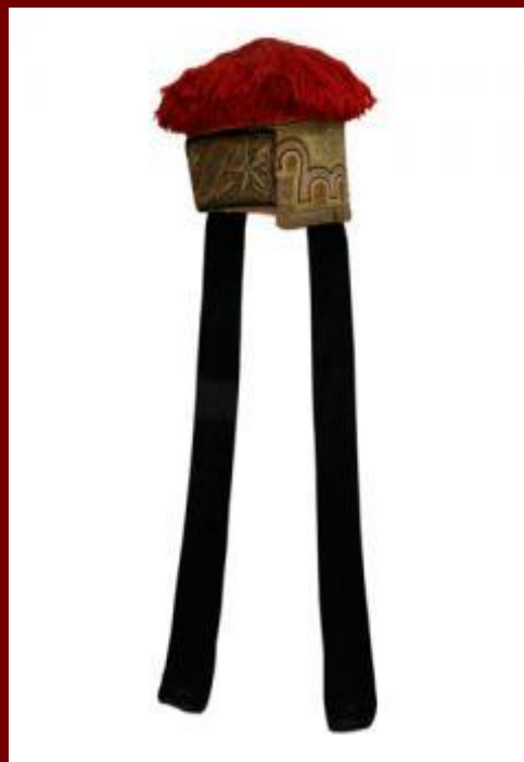
Шапка - шалмаг и шиверлики