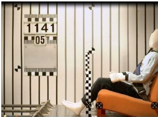
Рис 2а. Время 0 мсек. Манекен в исходном состоянии

Тест с фронтальным ударом по методике стандарта R44/04. На рисунке видно как нижняя часть ремня во время удара глубоко входит в живот манекена во время подныривания.