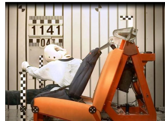
Рис 4с. Время 80 мсек. Начало подныривания. Нижняя часть ремня недопустимо проникает в область живота

Тест с фронтальным ударом в соответствии со стандартом R44/04.