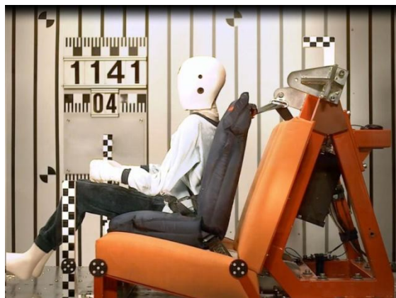
Рис 4б. Время 40мсек. Положение манекена и геометрия ремня во время фазы нагрузки.