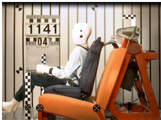
Рис 4б. Время 40мсек. Положение манекена и геометрия ремня во время фазы нагрузки.