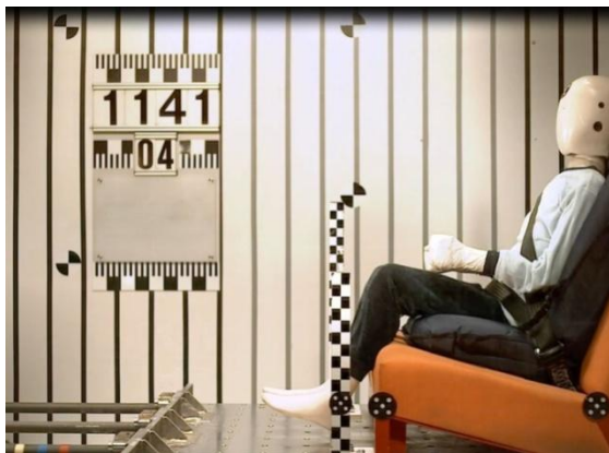
Рис 4а. Установка манекена.