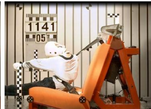
Рис 2в. Время 91 мсек. Началось подныривание, нижняя часть ремня недопустимо вошла в нижнюю часть живота.