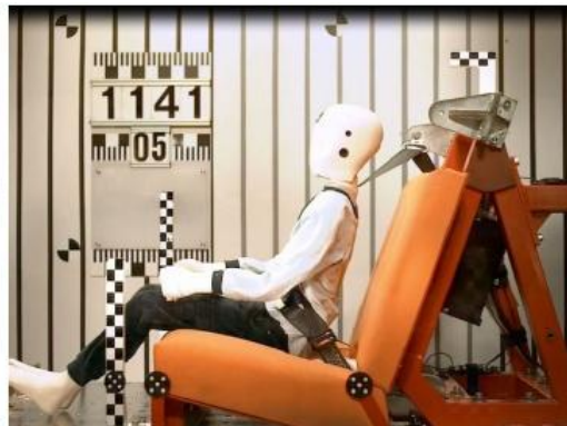
Рис 2б. Время 51 мсек. Манекен и положение ремня во время фазы нагрузки.