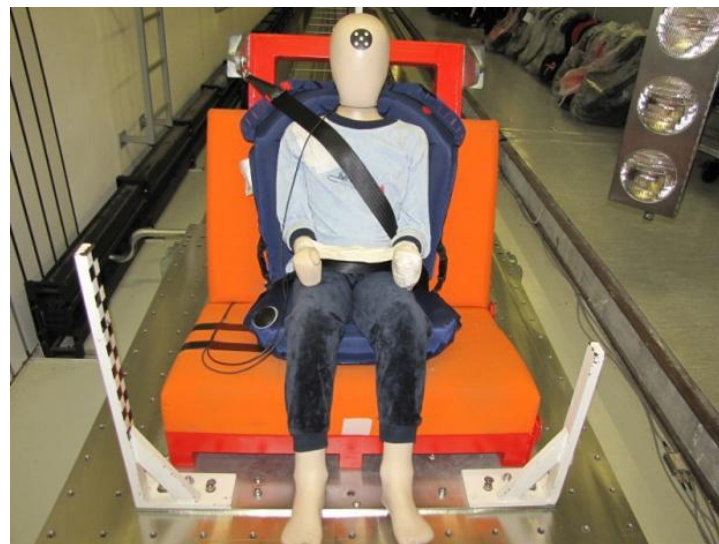
Рис 3. Подготовка к тесту.