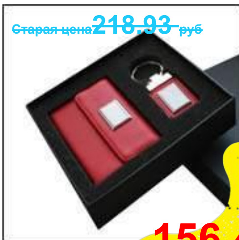
Старая цена 218.93 руб Артикул: 111.8149.09 Брелок, визитница, кожа