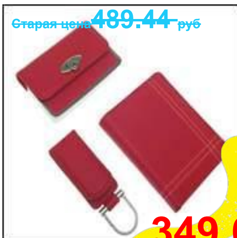
Старая цена 489.44 руб Артикул: 111.0088.17 Визитница, брелок, портмоне