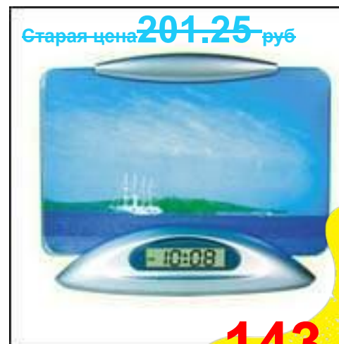
Артикул: 111.021.21 Фоторамка с часами