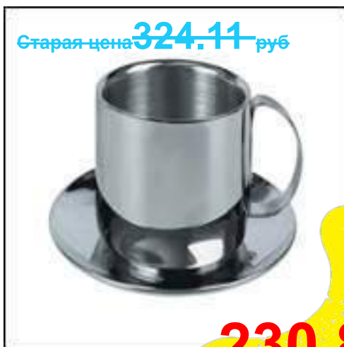
Артикул: 111.350012.13 Чайная пара