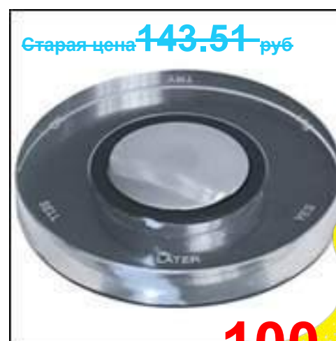
Артикул: 111.1395.22 Приниматель решений