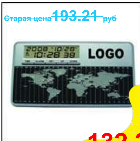
Артикул: 111.8811.54 Часы с мировым временем