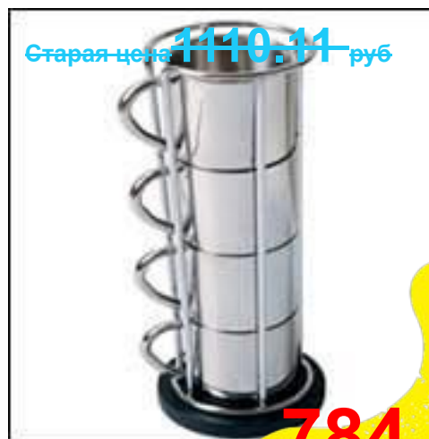
Артикул: 111.350027.11 4 кружки в стойке