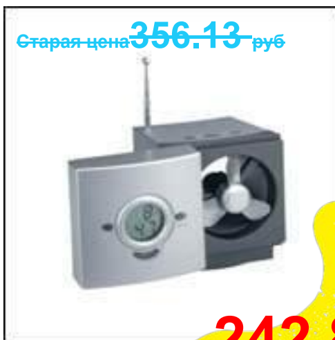
Старая цена 356.13 руб Артикул: 111.2830.17 Промо радио с вентильатором