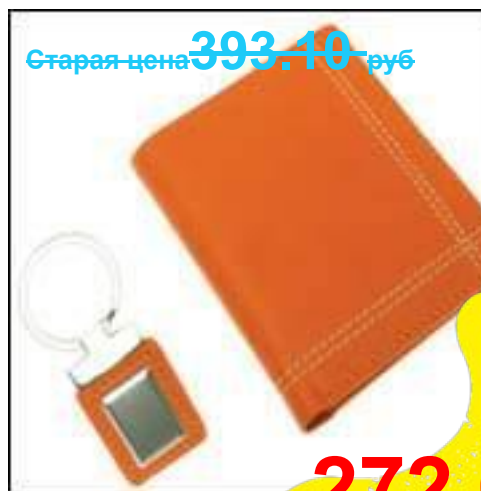
Старая цена 393.10 руб Артикул: 111.0098.12 Портмоне, брелок