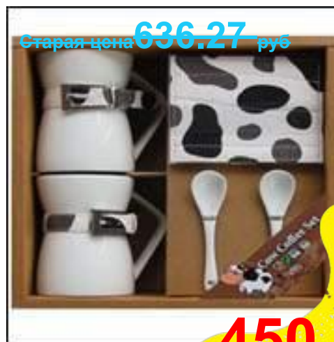
Артикул: 111.816010.21 Чайная пара