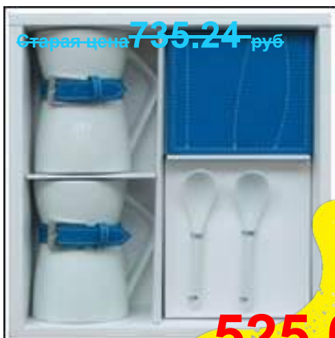
Артикул: 111.816010.22 Чайная пара