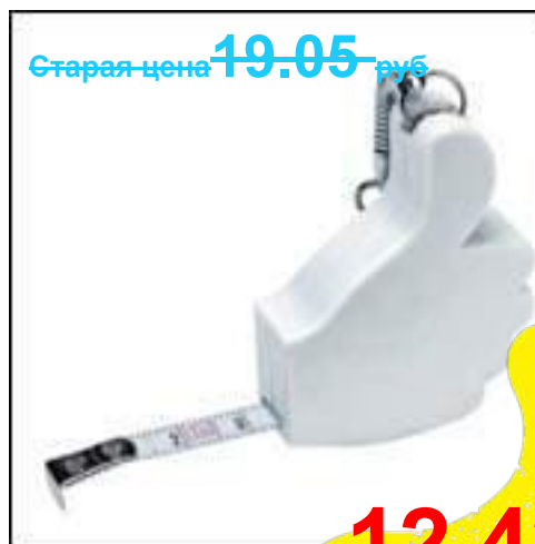
Старая цена 19.05 руб Артикул: 111.1127.25 Рулетка «Во!»