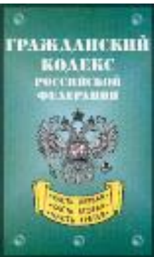
Оптимальное распределение рисков

— распределение (от лат. dividere — делить)