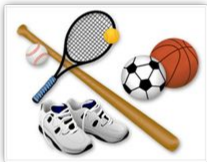
Товар / Услуга