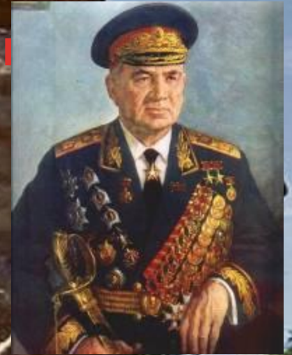
Чуйков В. И.

2 период обороны(12 сентября-18 ноября 1942г.)Бои происходили в самом городе. 11 ноября 1942 года фашисты предприняли последний штурм города но захватили лишь южную часть территории завода «Баррикады» С середины ноября 1942 г. Захватчики