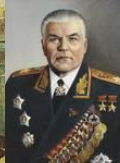
Рокоссовский К. Соколовский В. Малиновский Р.