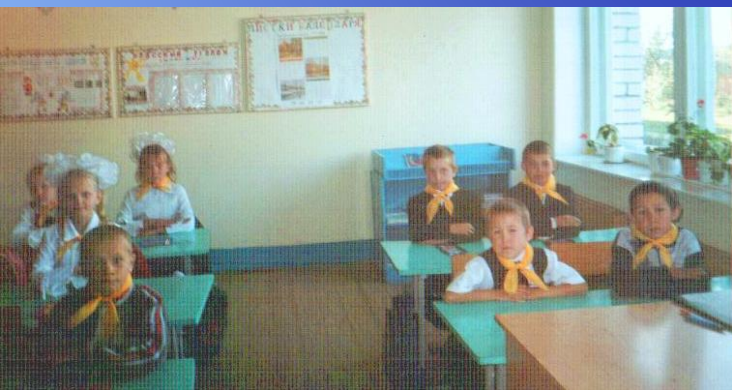
Наконец-то и мы имеем жёлтый галстук