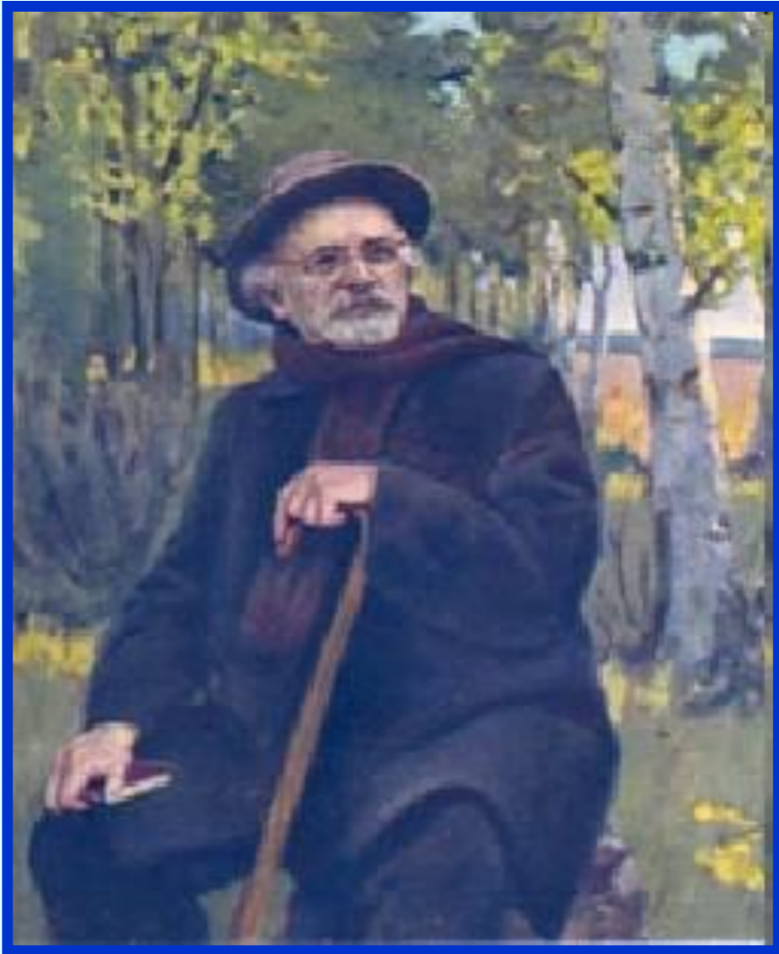
Михаил Михайлович Пришвин (1873 - 1954) - писатель (прозаик, публицист).