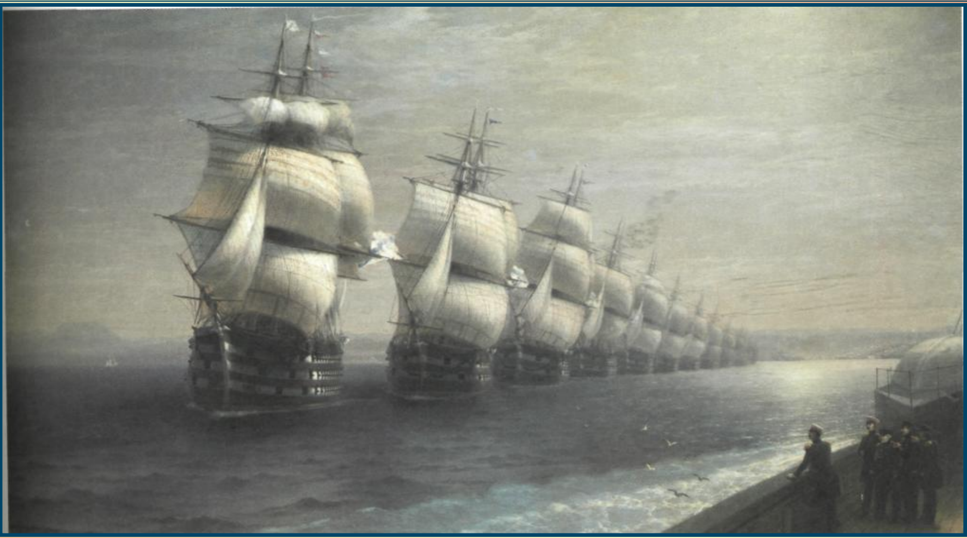
Иван Айвазовский «Бриг «Меркурий» после победы Над турецкими судами встречается с русской эскадрой». 1848 г.