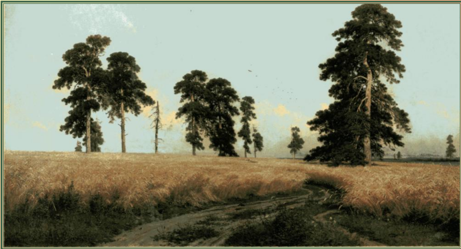
Иван Шишкин «Рожь». 1878 г. Профессор пейзажной живописи.

В своих работах художник умело передает законы линейной и воздушной перспективы.