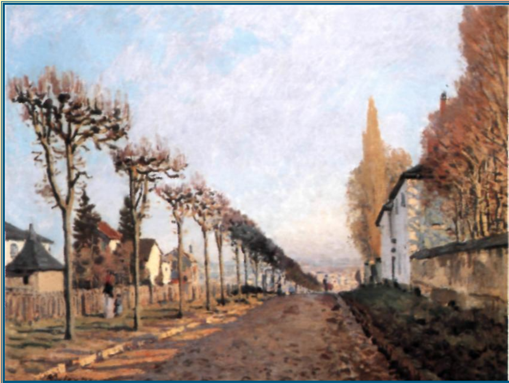
Альфред Сислей «Улица Севр в Лувесьенне». 1873 г.