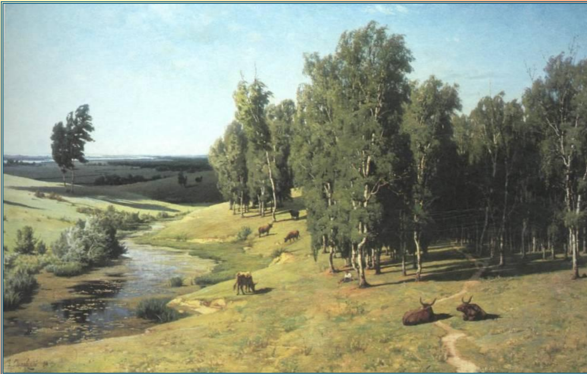
Владимир Орловский «Летний день». 1884 г.