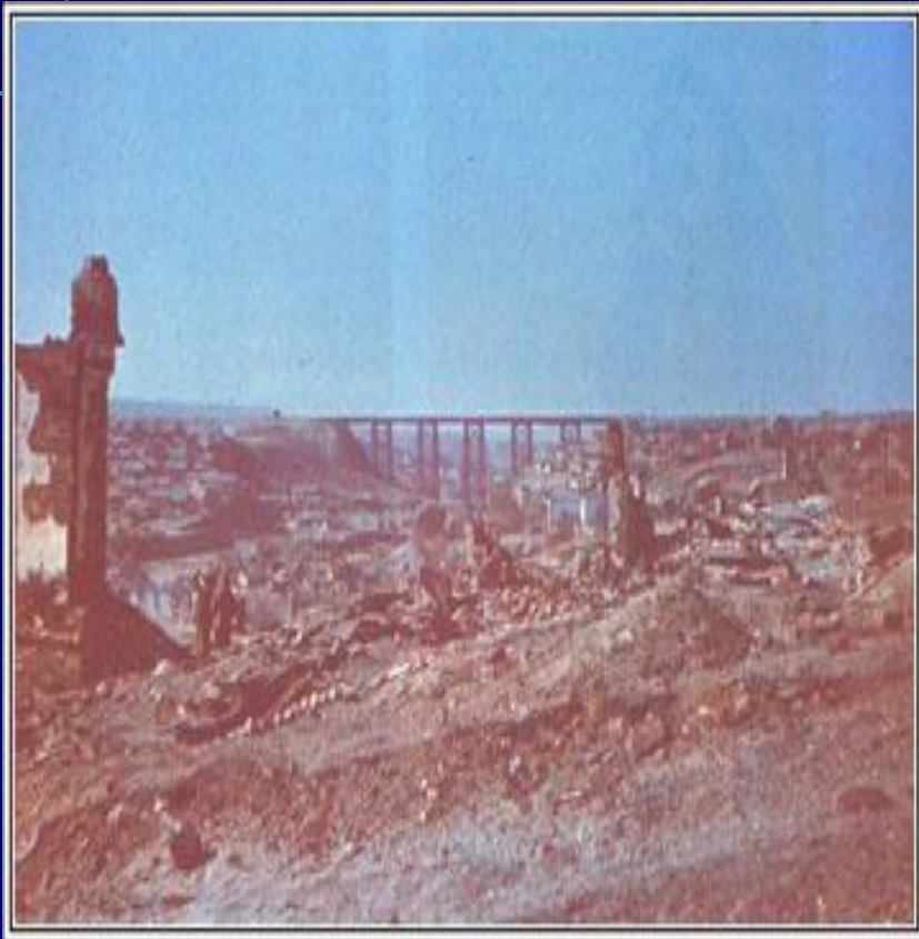
Разрушения в Сталинграде, октябрь 1942г.