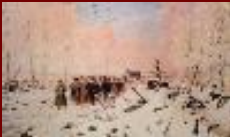
«На большой дороге. Отступление. Бегство.»