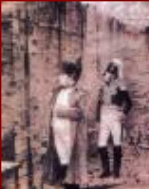
«В Кремле. Пожар»