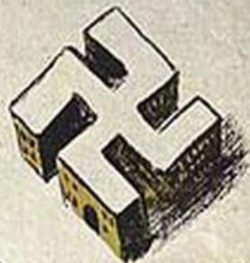
ФАШИЗМ - ЭТО ТЮРЬМА