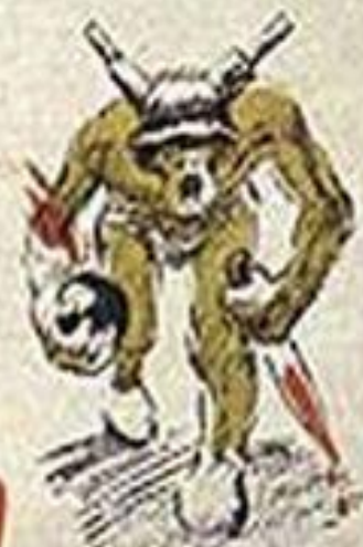
ФАШИЗМ - ЭТО ВОЙНА