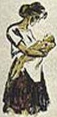
ФАШИЗМ - ЭТО ГОЛОД