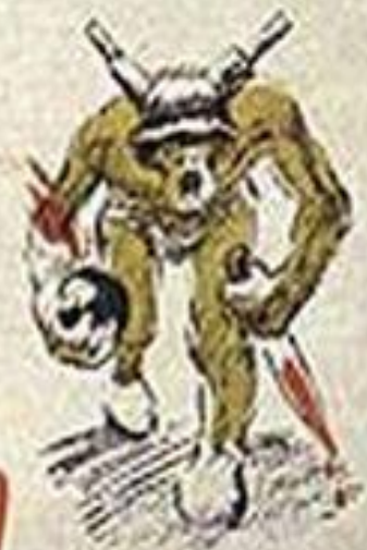
ФАШИЗМ - ЭТО ВОЙНА