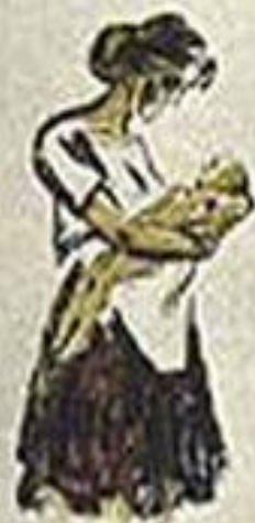
ФАШИЗМ - ЭТО ГОЛОД