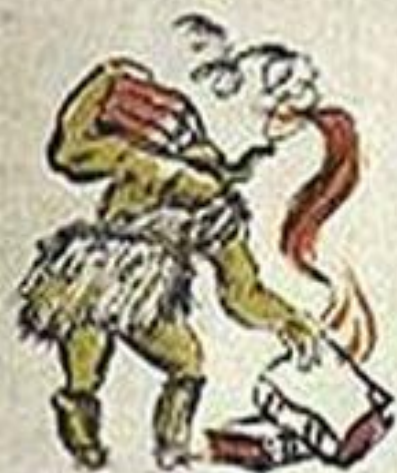
ФАШИЗМ - ЭТО УНИЧОЖЕНИЕ КВАДРУМ