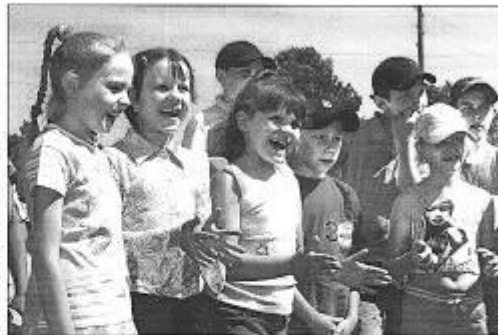
Радостные детишки, в Кузьминке на территории села построена новая детская площадка.