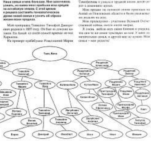
Татьяна ПОЛЮТКИНА, ученица 4 класса Бутычской школы.

«Дорогие читатели! Вопрос касается жилищной службы. Вопрос касается жилищной службы. Вопрос касается жилищной службы.