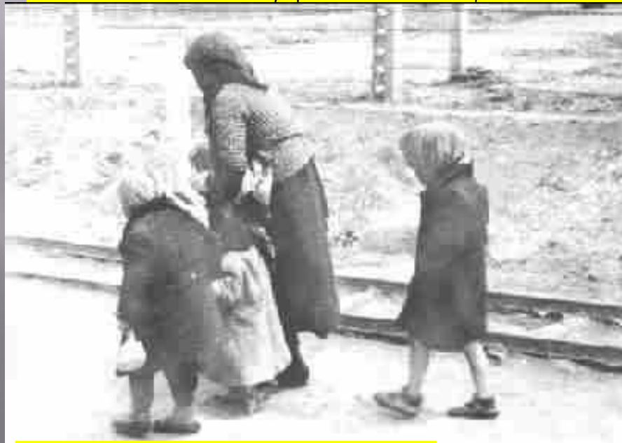
На пути к газовой камере.