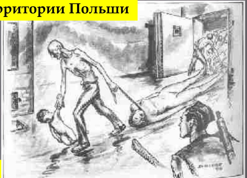
Разгрузка газовой камеры в Освенциме. Рисунок бывшего узника