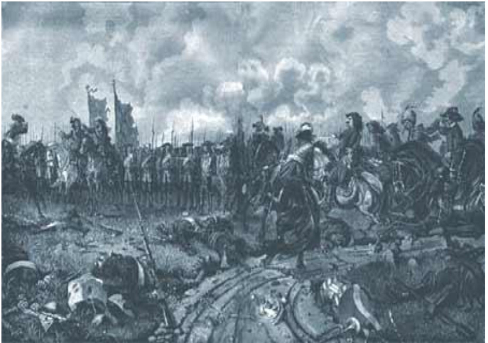
Петр перед битвой. Рис. Р.Штейна. 1899 г.