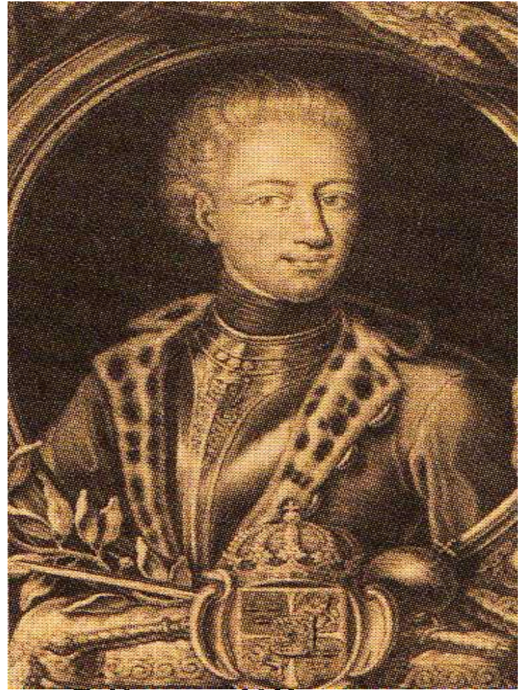
* Карл XII