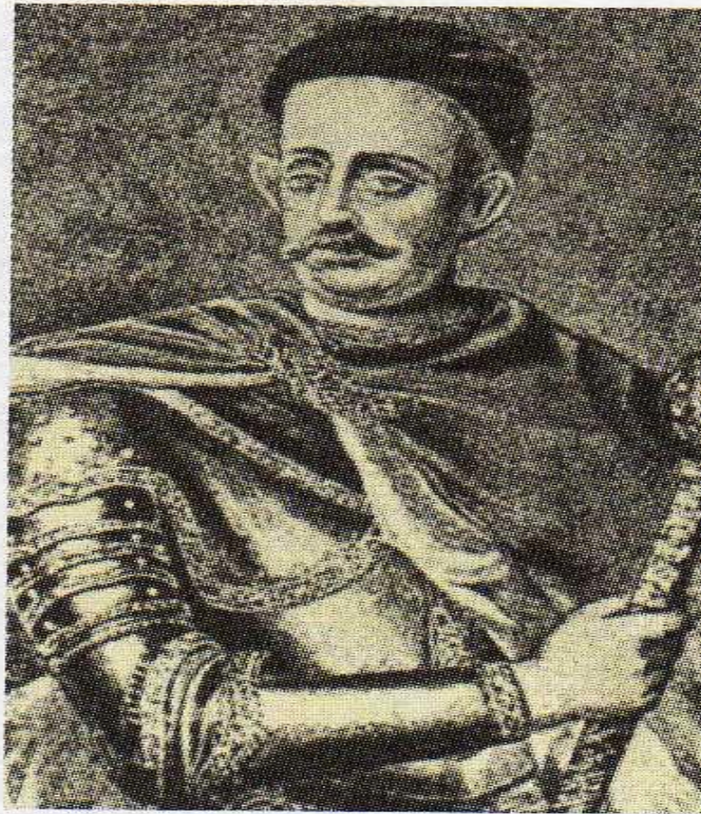
И. С. Мазена. Неизв. худ. Портрет из замка Гринсгольм. Кон. 1720-х гг.