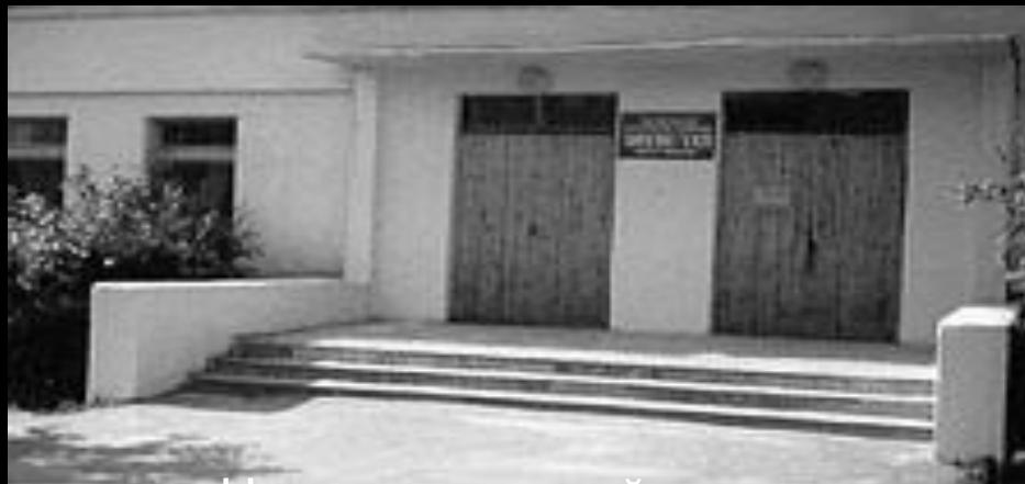
Центральная районная библиотека им. В.Я.Шишкова