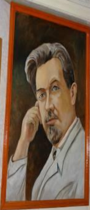
А.М.Арсеньев «Портрет В.Я. Шишкова»

Приемы создания комического в «шутейных» рассказах писателя