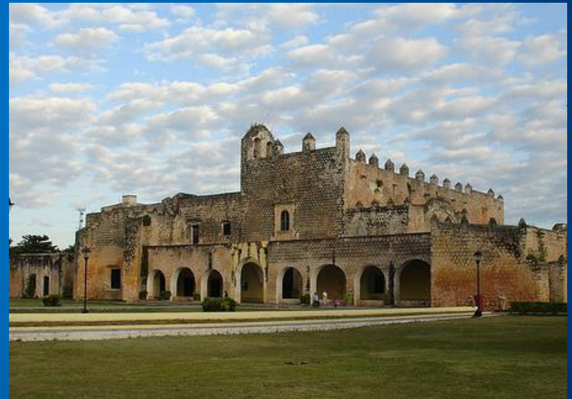
Вальядолид, столица Испанского королевства (1551 год).

Фамилия Сервантеса насчитывала пять столетий рыцарства и общественной службы и была не только распространена в Испании, но имела своих представителей в Мексике и других частях Америки.