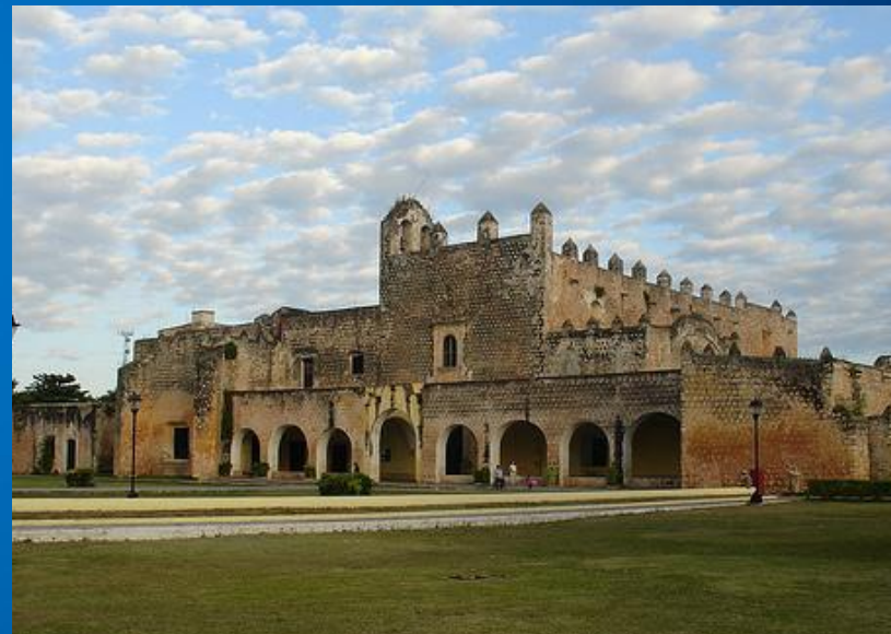
Вальядолид, столица Испанского королевства (1551 год).

Фамилия Сервантеса насчитывала пять столетий рыцарства и общественной службы и была не только распространена в Испании, но имела своих представителей в Мексике и других частях Америки.