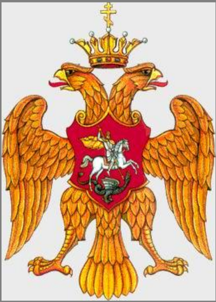
Герб 16 века

В самом своем начале (вплоть до XVI века) Россия была разрозненным государством, поэтому и речи о государственном гербе России идти не могло. государственный герб в России появляется уже при Иване III (1462-1505). Именно ему приписывается учреждение государственного герба, как такового. В качестве герба в то время выступала его печать. На Руси двуглавый орел появился после брака Иоанна III Васильевича и Софьи Палеолог, племяннице последнего Византийского императора Константина XII Палеолога.