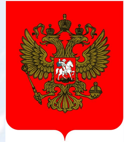
Герб 21 века