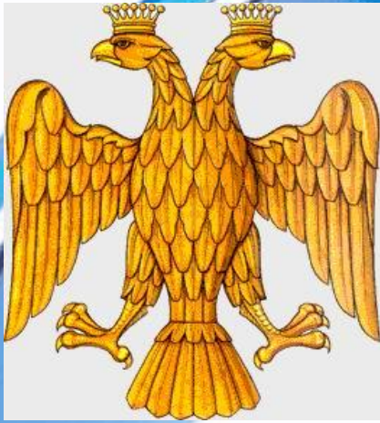
Герб 15 века