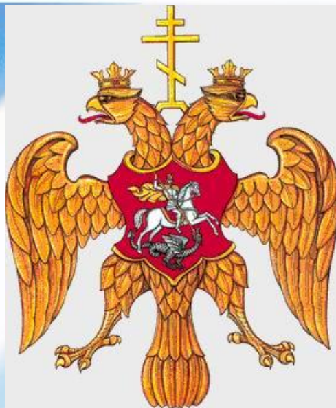
Герб 17 века