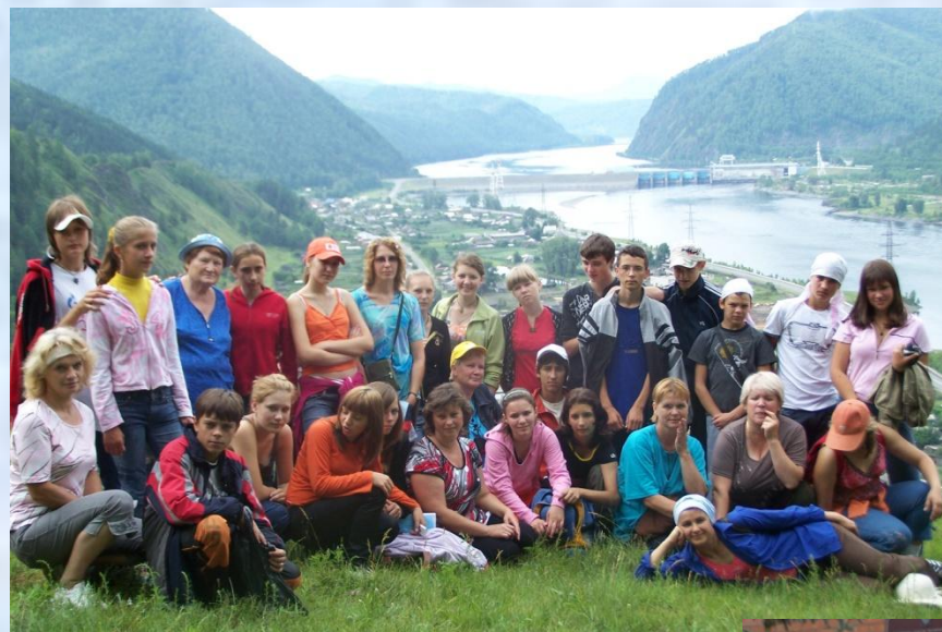
У музея Ивана Ярыгина