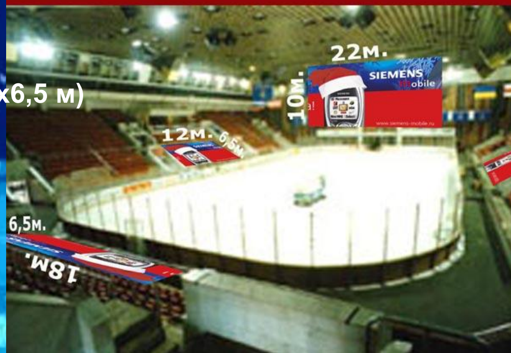
Схема размещения рекламоносителей на вечернем катке ЦСКА