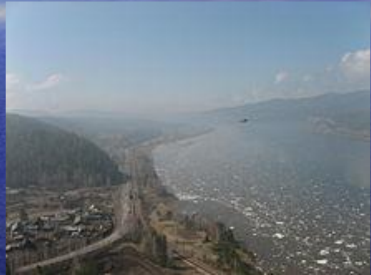
Село Овсянка в Красноярске.

● В 1950-е гг. издает в Перми книги рассказов для детей («До будущей весны», 1953, «Огоньки», 1955; итоговый сб. «Зорькина песня», 1960), роман о преобразовании отсталого колхоза «Тают снега» (1958). С 1958 — член Союза писателей СССР, в 1959-61 учился на Высших литературных курсах в Москве при Литературном институте им. М. Горького. С конца 1960-х гг. жил в Вологде, в 1980 вернулся в родные места, жил в Красноярске и селе Овсянка.