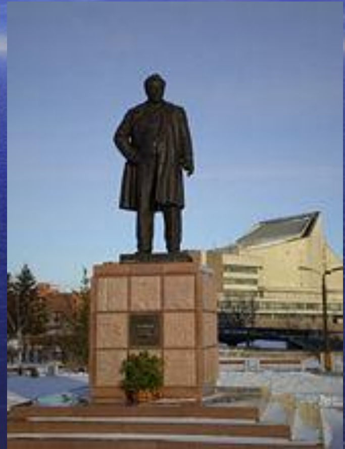
Памятник В.П. Астафьеву, в Красноярске