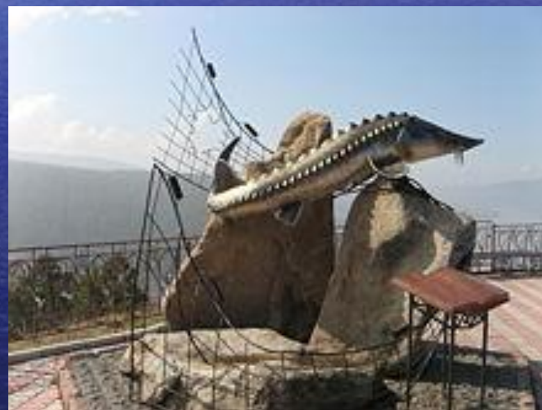
Памятник рассказу «Царь-рыба» , в Красноярске.